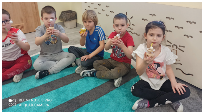
Na zajęciach nie zabrakło ciekawych ćwiczeń (Fot. PP nr 2)

Pierwsza zabawa – zabawa oddechowa wzbudziła w dzieciach wielki entuzjazm. Przedszkolaki ćwiczyły w niej długość oraz siłę wydechu, bawiąc się logopedycznymi dmuchawkami. Ich zadaniem było albo jak najdłużej utrzymać piłeczkę w powietrzu, czyli sprawić, aby „latała”, albo dmuchnąć szybko i krótko, aby poleciała wysoko i spała na podłogę. Zabawa ruchowo-słuchowo-artykulacyjna cieszyła się nie mniejszym zainteresowaniem. Już pierwsze dźwięki piosenki „Mam tę moc” z bajki „Kraina Lodu” sprawiły dzieciom wielką radość. Zadaniem przedszkolaków były odpowiednie reakcje na umówione sygnały. Podczas grania muzyki należało naśladować jazdę na łyżwach, natomiast