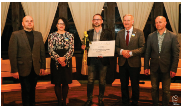
Nagroda Starosty dla Zespołu Folklorystycznego