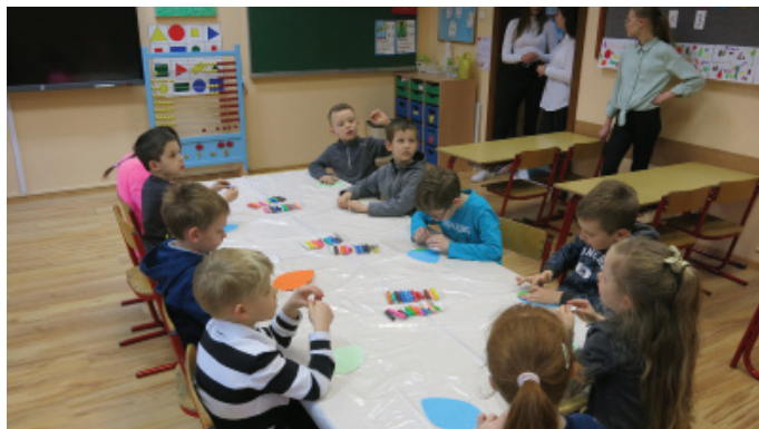
Dla dzieci przygotowano ciekawe zajęcia (Fot. SP 1)

Dzieciaki mogły uczestniczyć w zajęciach kodowania, edumatrix, logorytmiki, plastycznych, sportowych i świetlicowych. Nasi przyszli uczniowie, pod czujnym okiem nauczycieli, mogli wykazać się