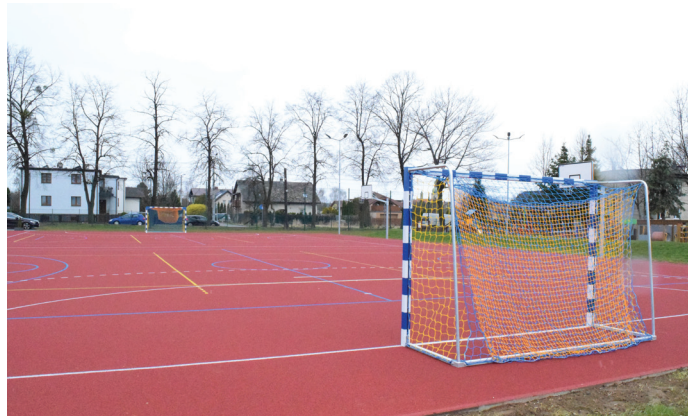
Boisko jest już gotowe!

Prace wykonało PPHU CHEC Kazimierz Chęć z Rudy Śląskiej. Wartość zamówienia to 368 tys. 992 zł.