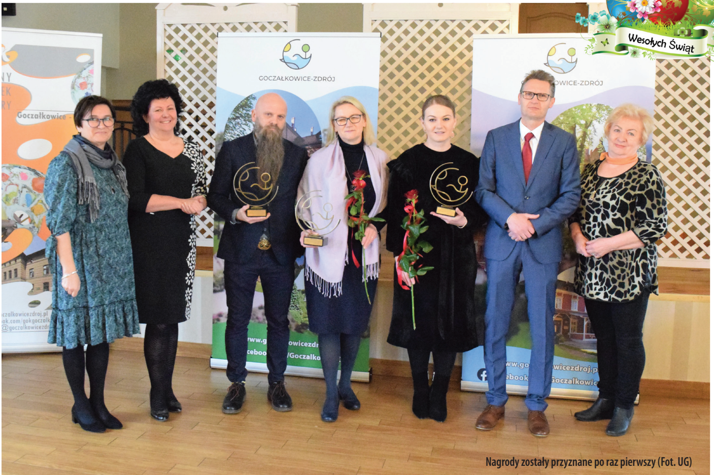
Nagrody zostały przyznane po raz pierwszy