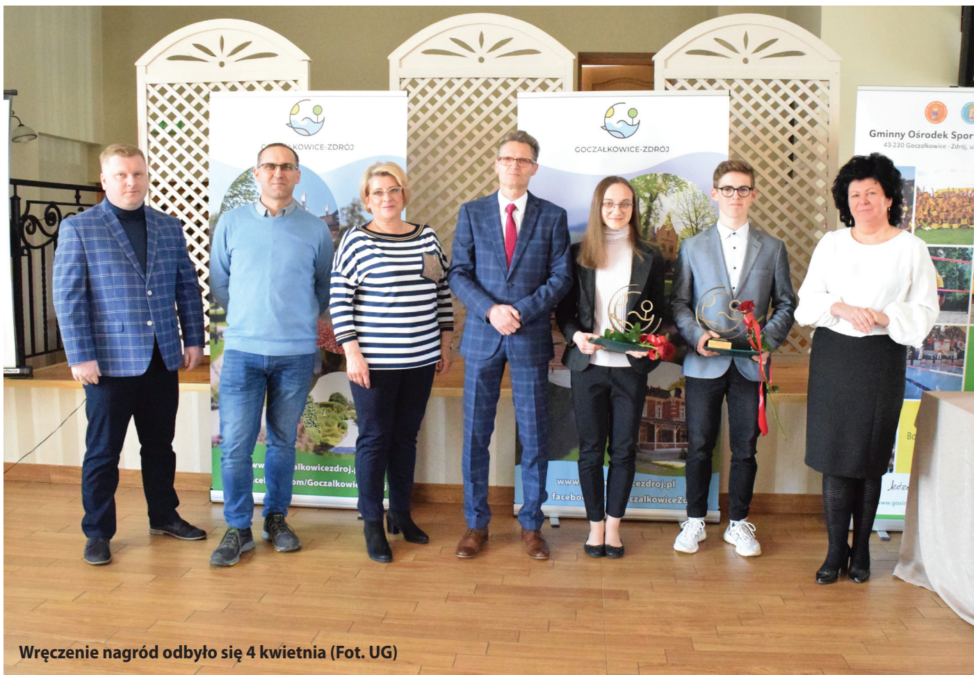
Wręczenie nagród odbyło się 4 kwietnia