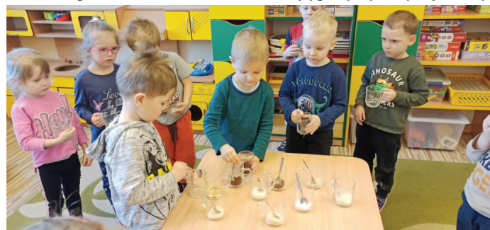
Dzieci przeprowadziły ciekawe eksperymenty z wodą

Wiele przyjemności sprawiło dzieciom spotkanie z ratownikiem