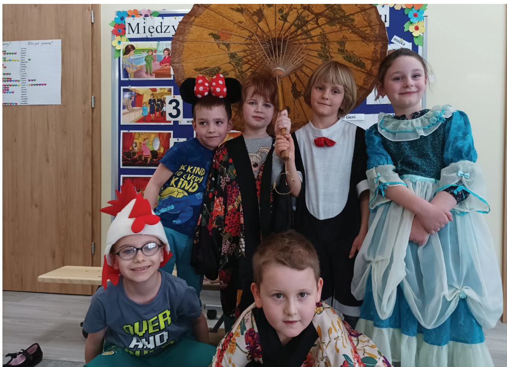
Dzieci poznały świat teatru