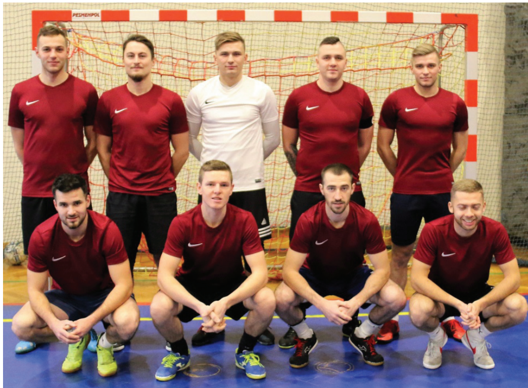
Stado Goczałkowice-Zdrój – mistrzowie I ligi

Liga Futsal Pszczyna-Suszec-Goczałkowice, sezon 2021/2022 I liga