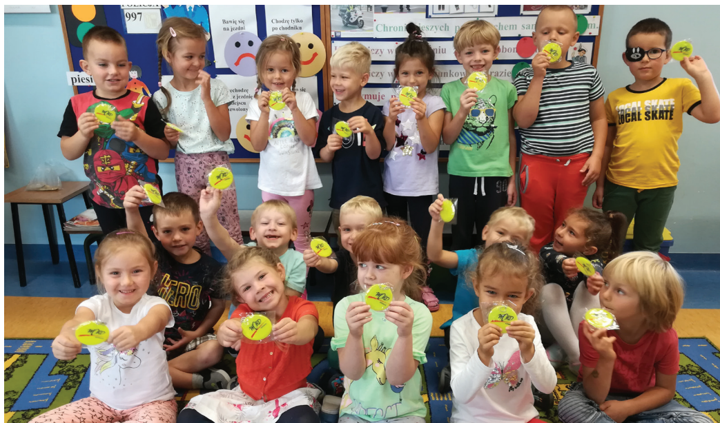
Odblask to element, który sprawia, że jesteśmy widoczni na drodze

We wrześniu przedszkolaki opracowały swoje „Grupowe Kodeksy”, w których zostały zawarte zasady i reguły dobrego zachowania w sali i na placu zabaw. Mając na uwadze ważność znajomości podstawowych zasad ruchu drogowego, nauczycielki zorganizowały cykl zajęć poświęconych tej tematyce, a mianowicie „Wiemy, gdzie mieszkamy”, „Zebra na ulicy”, „Zasady ruchu drogowego”, „Starszaki się nie zgu-