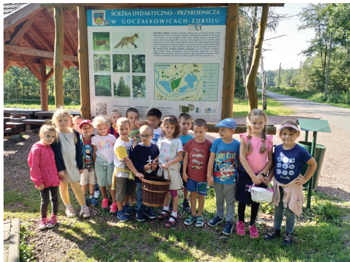
Dzieci w okolicy altan w Borze (Fot. PP 2)

W ramach działań związanych z projektem edukacyjnym „Okna Ziemi” dzieci z grupy starszej „Pszczółki” uczestniczyły w wycieczce do lasu. Przedszkolaki wyruszyły na spacer leśnymi drózkami we wtorek, 15 września. Przy wspaniałej pogodzie poznawały przyrodę patrząc, słuchając i dotykając. Obserwowały las, który kryje w sobie wiele ciekawych tajemnic. Poznawały różnorodność szaty roślinnej: drzewa iglaste, liściaste, krzewy, mchy, runo leśne. Słuchały odgłosów lasu, a do kąciku przyrodniczego zbierały „skarby”, które można znaleźć późnym latem. W koszyku znalazły się różnego rodzaju liście, szyszki i żołądźcie.