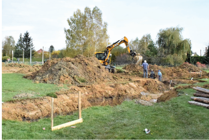
Prace ruszyły w drugiej połowie października

– Rozpoczęliśmy dużą i tak ważną inwestycję. Chcemy stworzyć naszym najmłodszym mieszkańcom jak najlepsze warunki do zabawy i uczenia się. Wykonawca ma rok na realizację inwestycji, dlatego nowe przedszkole powinno być gotowe końcem