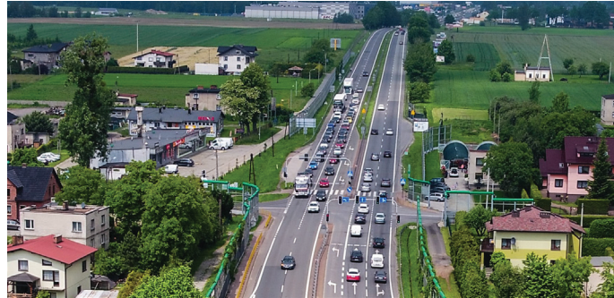
Gmina planuje budowę drogi wzdłuż DK 1 do ronda przy zakładach mięsnych

Zlecenie dokumentacji projektowych jest konieczne, żeby móc przeprowadzić kolejne duże inwestycje. Planowane jest przygotowanie projektu budowy drogi wzdłuż DK 1 do ronda przy zakładach mięsnych wraz z przedłużeniem ul. Robotniczej do ronda. Kolejne projekty dotyczyć będą przebudowy ul. Powstańców Śląskich z mostem i regulacją pasa drogowego oraz podziałami, budowy drogi rowerowej w kierunku Jeziora Goczałkowickiego – przez Bór II wzdłuż Kanaru oraz groblą do Wisły, a także budowy par-