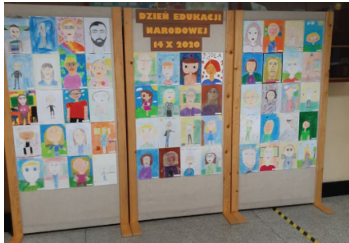
UG Portrety nauczycieli przygotowane przez uczniów SP nr 1

Zyczenia dla nauczycieli i pracowników oświaty skierowała Gabriela Placha, wójt gminy Goczałkowice-Zdrój.