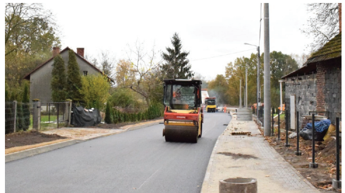
Na realizację inwestycji gmina pozyskała 50% dofinansowania