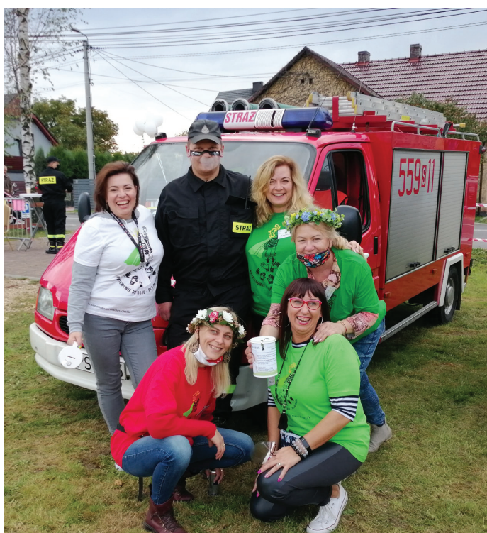
Impreza się udała dzięki pracy wielu ludzi dobrych serc