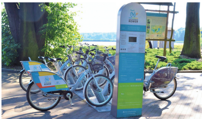
Jedna ze stacji znajdowała się przy Starym Dworcu

Pomimo tego, o popularności usługi świadczy fakt, że w 2020 r. przybyło aż 1059 nowych użytkowników systemu. Łącznie jest ich 5006, to głównie osoby w wieku 30-39 (prawie 32%) oraz 40-49 (25%). Średni czas wypożyczeń to prawie 50 minut. W ramach systemu pierwszych 30 minut było darmowe.