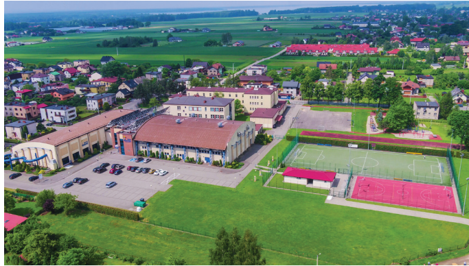
Nowe przedszkole powstanie w sąsiedztwie Szkoły Podstawowej nr 1 oraz Krytej Pływalni „Goczuś”

Sporo czasu wymagały kolejne uzgodnienia, przygotowanie projektu budowlanego. Teraz możemy się pochwalić wymiernym efektem tych starań. – Drodzy rodzice! Mam bardzo dobrą wiadomość. Uzyaskaliśmy pozwolenie na budowę nowego przedszkola w Goczał-