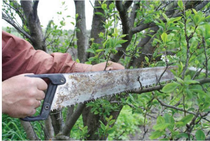
Na każdym mieszkańcu ciąży obowiązek dbania o swą posesję.

Administracja Zasobów Komunalnych, jako administrator dróg gminnych, zwraca się z prośbą o usunięcie drzew, krzewów i innych roślin posadzonych w poboczu dróg przez właścicieli nieruchomości przyległych do nich. W sytuacjach zagrażających bezpieczeństwu oraz utrudniających prawidłowe korzystanie z dróg i chodników zostaną one usunięte przez administratora drogi bez powiadomienia i odszkodowania.