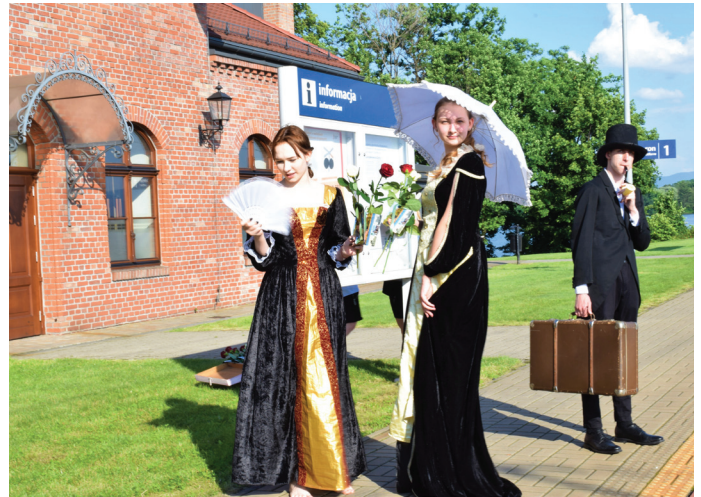
Dzięki strojom z tamtych lat Stowarzyszenie „take tam” im. Artystów Międzywojnia wprowadziło uczestników w klimat II połowy XIX w.