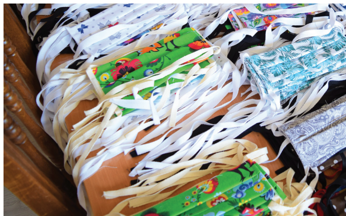
Urząd Gminy zamówił 6,5 tys. maseczek ochronnych, które zostały bezpłatnie dostarczone mieszkańcom

tys. 600 zł. Ze sprzętu korzysta 8 nauczycieli i 13 uczniów. Został zakupiony ze środków Programu