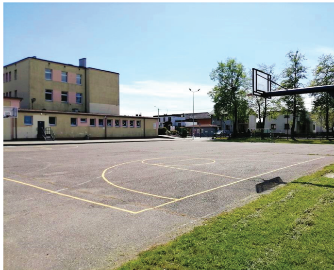
Istniejące boisko zostanie wyremontowane i rozbudowane

Gmina Goczałkowice-Zdrój złożyła do Ministerstwa Sportu wniosek o dofinansowanie inwestycji w ramach programu „Sportowa Polska”. Całkowita wartość zadania to 895 tys. 332 zł. Gmina ubiega się o dofi-