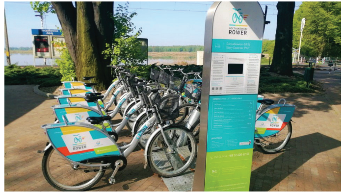
Stacje ponownie znajdują się przy Starym Dworcu oraz przy koronie zapory

Żeby skorzystać z wypożyczalni należy mieć aktywne konto. Opłata inicjalna wynosi 10 zł.