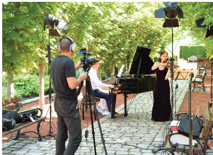
Podczas nagrań pierwszych koncertów w Ogrodach Kapias

w kolejne niedziele. Pierwsza emisja odbyła się 5 lipca na kanale GOK na YouTube. Link jest dostępny też na goczałkowiczdroj.pl .