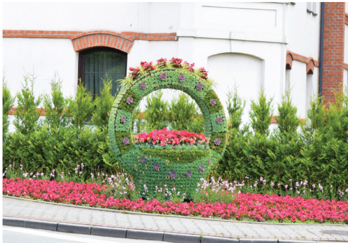
Kolorowo zrobiło się przy rondzie „Pod Bocianem”

Ale to nie wszystko. Wykonane zostały też prace polega-