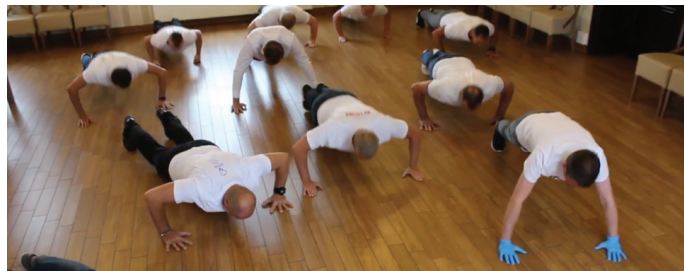
Goczałkowice pompują!