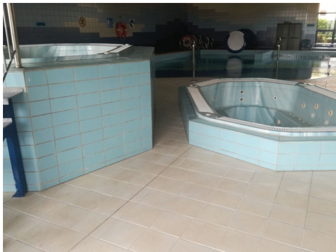
Prace prowadzono zarówno w obiekcie, jak i na zewnątrz

Oprócz tego w łazienkach i szatniach basenowych zostały wymienione oprawy oświetleniowe i wywietrzniki. Odmalowano również ok. 450 m kw ścian i sufitów korytarzy oraz pomieszczeń w hali sportowej oraz na „Orliku”. Prace toczyły się również na zewnątrz. Wykonano cięcia pielęgnacyjne drzewek i krzewów ozdobnych przy hali basenowej i hali sportowej.