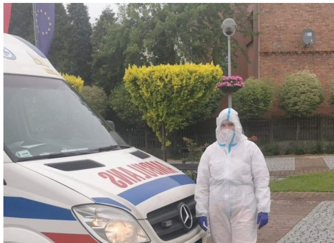
Wymazobus pobiera wymazy od mieszkańców Goczałkowic wskazanych przez sanepid

Gmina otrzymała dotację na zakup sprzętu do realizacji kształcenia na odległość. Dzięki temu do uczniów i nauczycieli trafiło 16 laptopów z oprogramowaniem, 5 tabletek i 5 drukarek. Wnioskiem objęto Szkołę Podstawową nr 1 w Goczałkowicach-Zdroju oraz CETiR Niepubliczną Szkołę Podstawową z Oddziałami Integracyjnymi. Dofinansowanie wyniosło 59