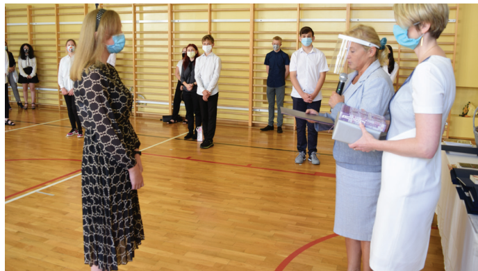
Świadectwa ukończenia szkoły odebrało 36 uczniów

Z okazji zakończenia roku szkolnego Szkoła Podstawowa nr