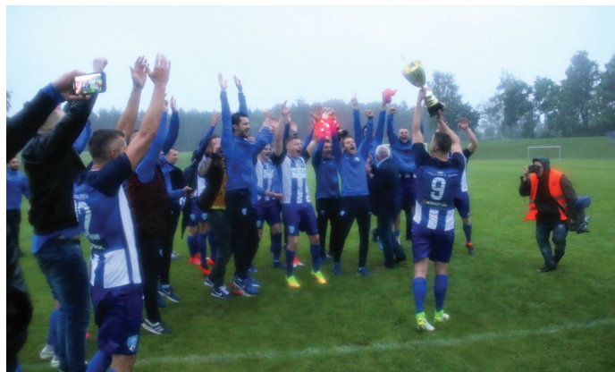
Ogromna radość po ostatnim gwizdku sędziego.