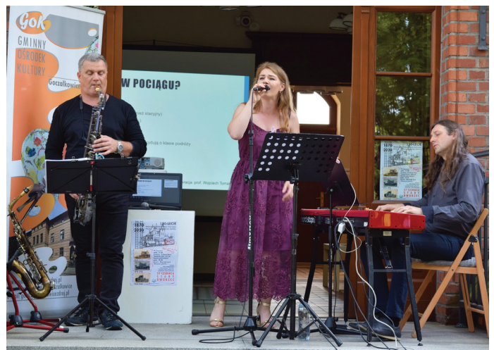
W podróż, tym razem muzyczną, zabrało trio Moonlight band