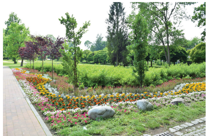
Piękne rośliny w Parku Zdrojowym

jące na obsadzeniu i pielęgnacji rabat kwiatowych na terenie gminy. Kolorowe kwiaty jednoroczne, w tym begonie, aksamitki, pelargonie czy dalej pojawiły się na rabatach znajdujących się przy skrzyżowaniu