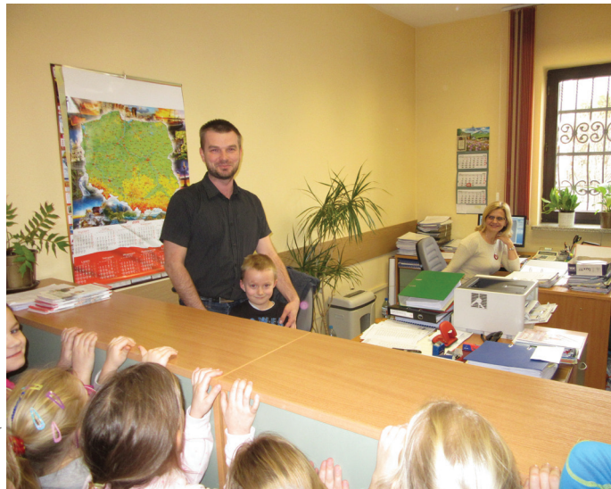
Goście mogli się dowiedzieć, jak się pracuje w urzędzie.