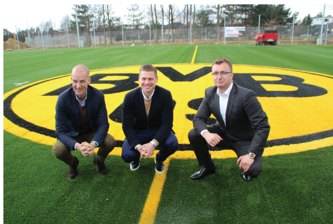
Zgrupowani mogli zobaczyć, na jakim etapie są roboty przy ul. Uzdrowskiej 44.

boisko ze sztuczną nawierzchnią z pełnym oświetleniem, budynek szatni z pomieszczeniami odnowy biologicznej i rehabilitacji, budynek techniczny, trybuna dla 304 osób przy boisku głównym, mniejsza trybuna przy boisku treningowym. Inwestycja realizowana przez Fundację Akademia Łukasza Piszczka warta jest 8 mln 893 tys. 954 zł, z czego 4 mln stanowi dofinansowanie z Ministerstwa Sportu i Turystyki. Obiekty sportowe będą funkcjonować jako Panattoni Arena.