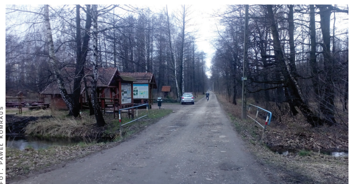
Droga ma być przebudowana na długości 2331 mb.