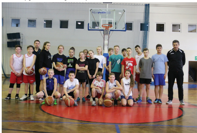
Spotkanie koszykarskich trójek na hali sportowej "Goczuś".

W czasie zimowej przerwy od nauki dzieci oraz młodzież aktywnie korzystała z promocyjnych wejść na basen (335 osób), była również możliwość poćwiczyć na siłowni czy hali sportowej (68 osób). W czasie ferii na basen „Goczuś” przyjeżdżały również grupy zorganizowane spoza gminy Goczałkowice-Zdrój. Były to grupy m.in.: z Czechowic-Dziedzic, Bielska-Białej, Jasienicy, Grodzca, Pszczyny, Łąki