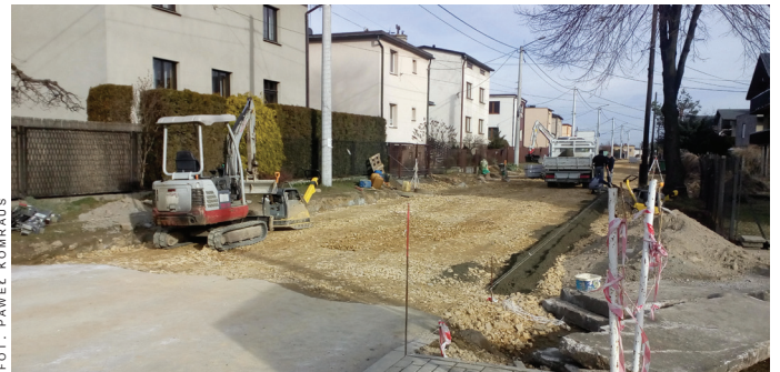
Droga będzie przebudowana na odcinku 580 mb.

Wartość prac to 1 mln 714 tys. 796 zł brutto. Przebudowa drogi będzie dofinansowana częściowo ze środków budżetu państwa tj. Programu na Rzecz Rozwoju oraz Konkurencyjności Regionów poprzez Wsparcie Lokalnej Infrastruktury Drogowej, w kwocie 293 tys. 435 zł.