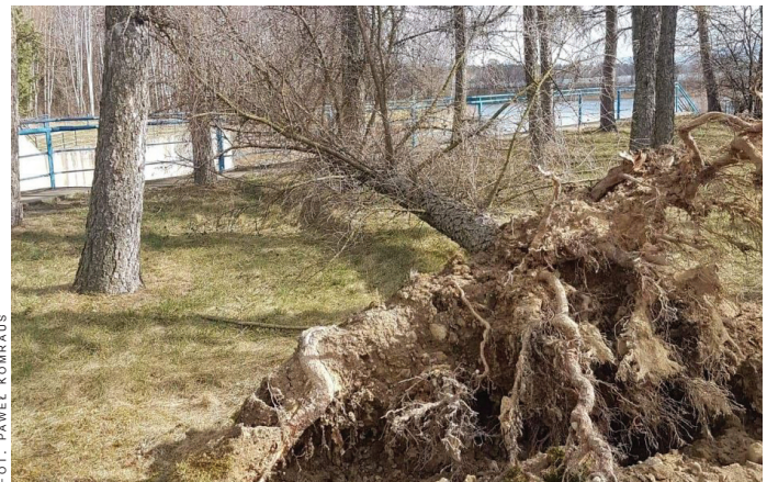
Powalone drzewo przy zaporze.