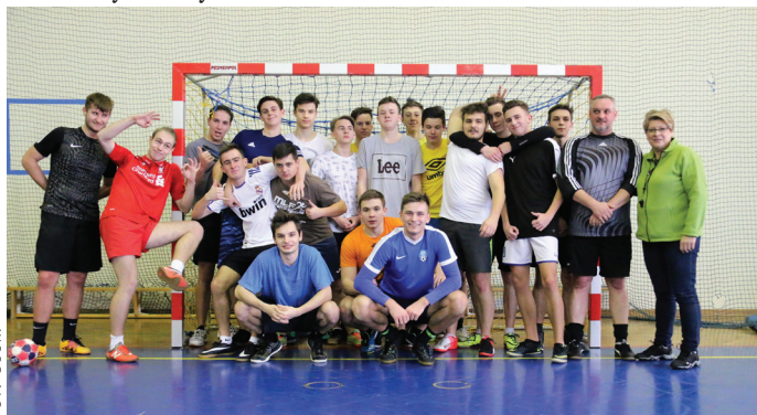
Uczestnicy goczałkowskiego Turnieju Futsalu Żaków.