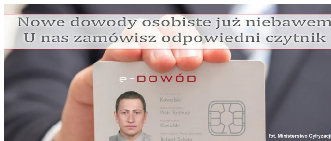
Od marca będą obowiązywać nowe e-dowody osobiste.

oraz uprawnia do przekraczania granic niektórych państw, które uznają go za dokument podróży.