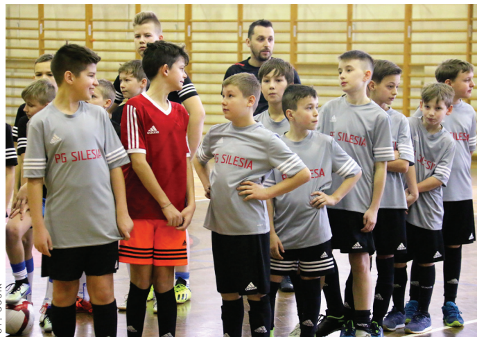
Pierwsza edycja Turnieju Futsal Młodzików okazała się wielkim sukcesem.