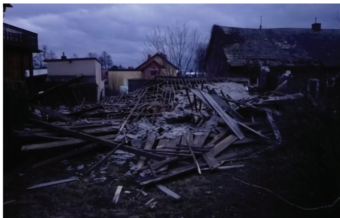
Zwalony budynek gospodarczy w Goczałkowicach.