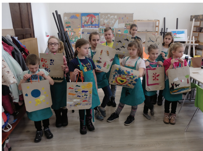
Ekologiczne torby z papieru wykonane w ramach zajęć Kreatywnej Pracowni.