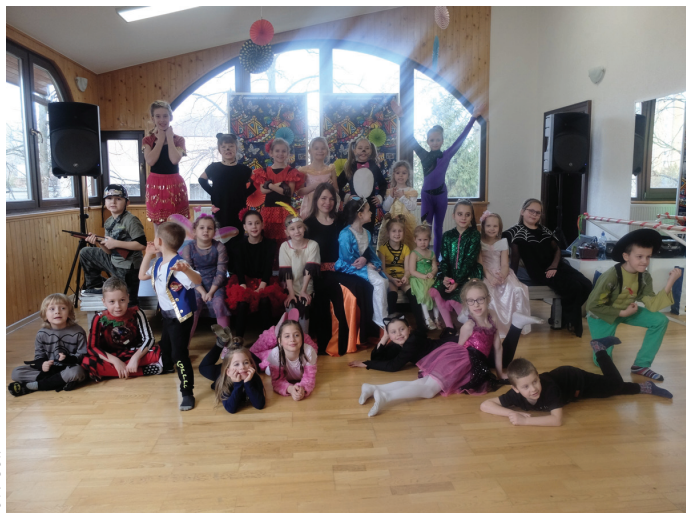
Karnawałowy bal przebierańców dla najmłodszych - prowadzenie Eden Sport.