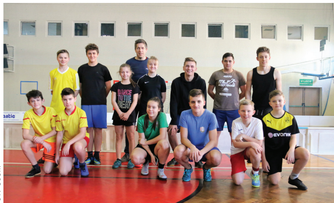
Ferie rozpoczęły się od Turnieju Futsalu Młodzików.

W sumie w rozgrywkach turniejowych oraz wyjazdach na lodowisko akcji „Ferie z Goczusem 2019” wzięło udział 287 osób.