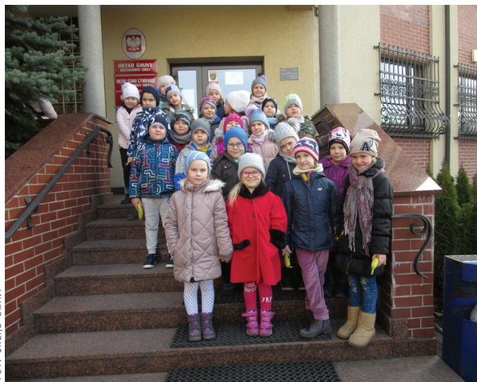
Przedszkolaki odwiedziły Urząd Gminy.