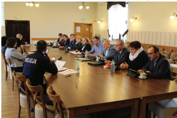
Radni pytali m.in. o patrole policji na DK1.