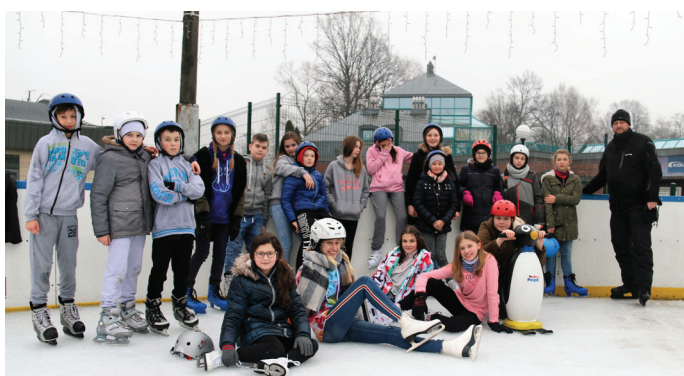
Goczałkowska grupa na lodowisku w Czechowicach-Dziedzicach.