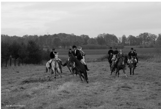
Fot. Wojciech Smolarz

Od paru lat TSG „Inicjatywa” organizuje imprezy otwarte o nazwie „Hubertus czyli pogoń za lisem”. „Lisem” jest jeździec z przypiętą do ramienia lisią kitką. Tegoroczna impreza odbyła się na terenach obok ul. Letniej. Teren ten doskonale nadaje się na tego typu ofertę spędzenia czasu. Mimo nie najlepszej pogody na starcie stanęło 19 koni i 1 za przeg. Również publiczność dopisała w liczbie kilkaset osób.