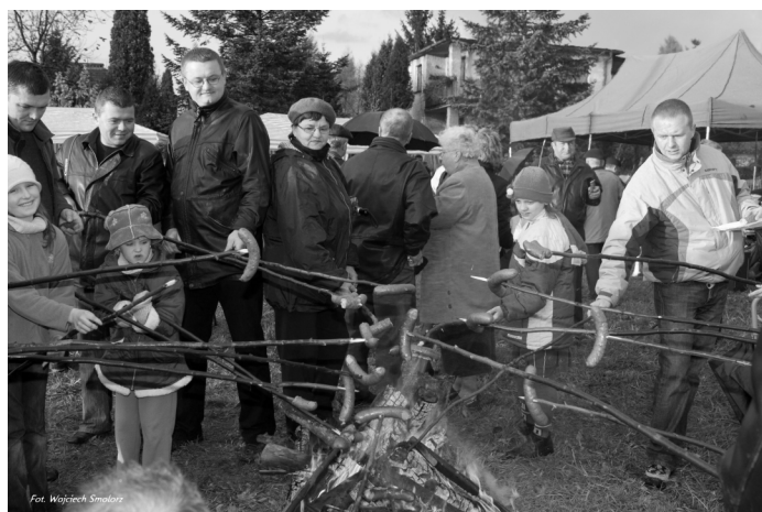
Fot. Wojciech Smolarz