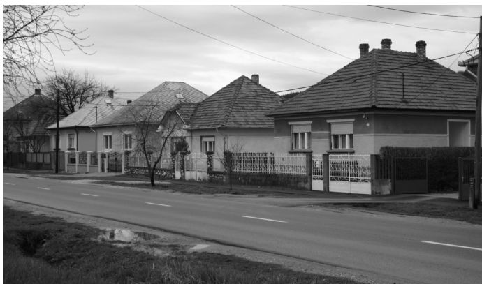
Parasznya - siedziba władz gminy