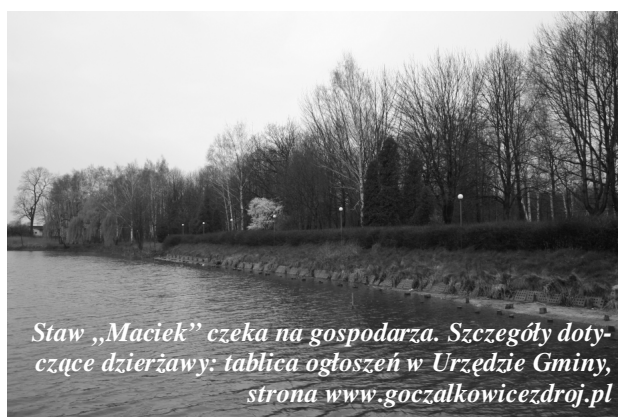
Staw „Maciek” czeka na gospodarza. Szczegóły dotyczące dzierżawy: tablica ogłoszeń w Urzędzie Gminy, strona www.goczalkowiczdroj.pl