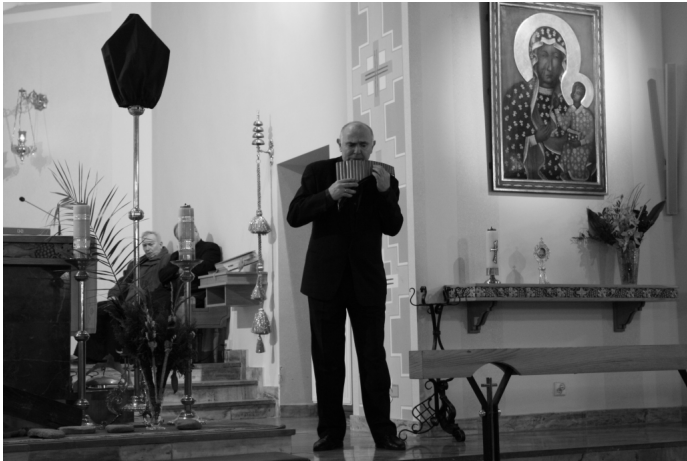
W Kościele Parafialnym dźwięki fletni Pana rozbrzmiewały po raz pierwszy

CZASOPISMO SAMORZĄDOWE GMINY GOCZAŁKOWICE-ZDRÓJ