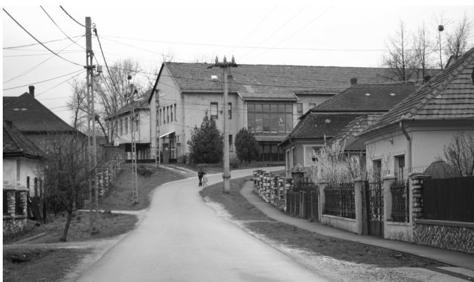
Parasznya - w głębi budynek szkoły