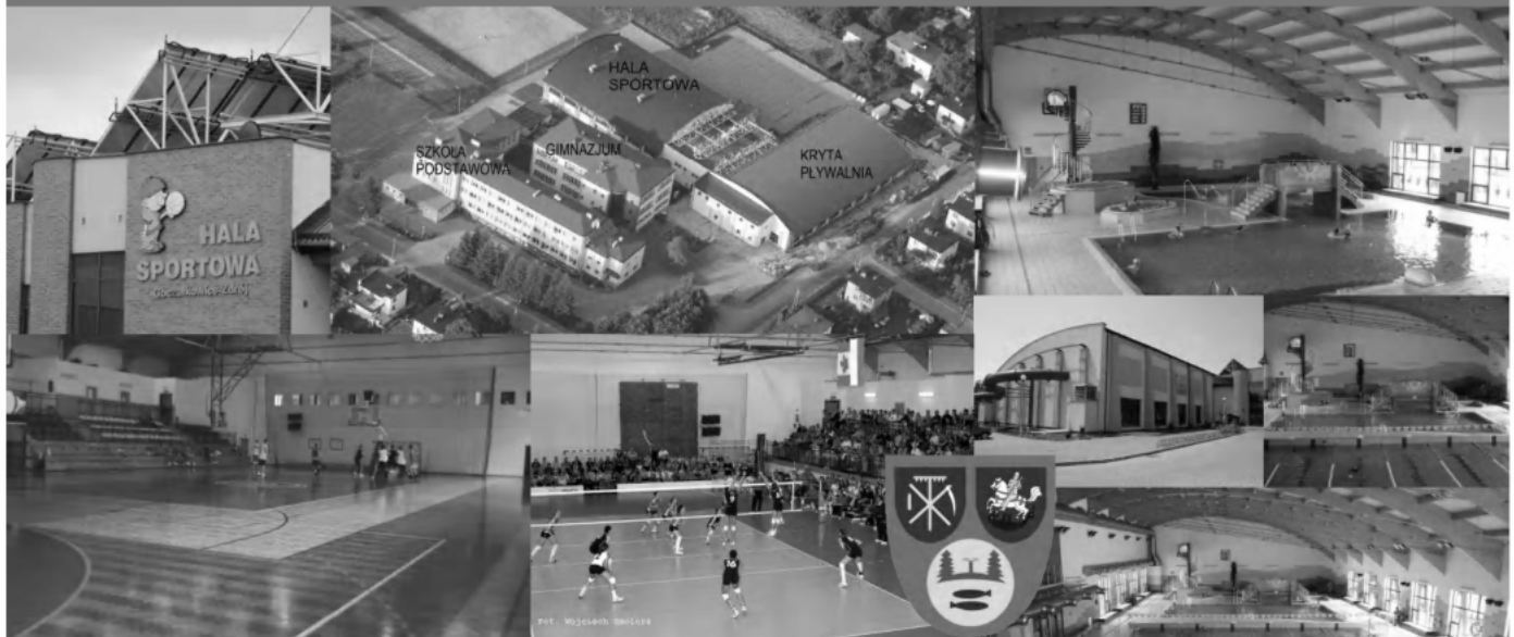
Kompleks Sportowo-Rekreacyjny w Goczałkowicach-Zdroju