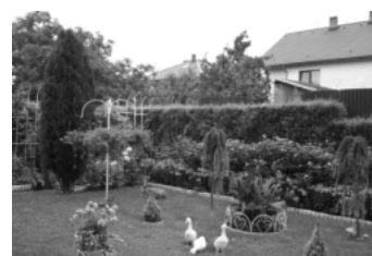
III miejsce w konkursie: Edyta i Andrzej HAMERLAK (ul. Wypoczynkowa)