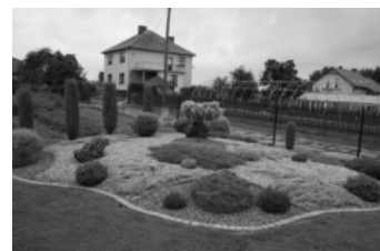
III miejsce w konkursie: Danuta i Zbigniew NIEĆ (ul. Powstańców Śląskich)