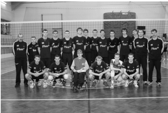
Na zdjęciu drużyna reprezentacji Polski Juniorów w siatkówce