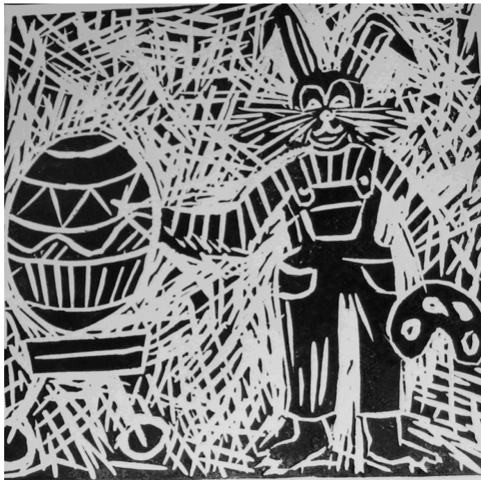
LINORYT WYKONAŁA EWA JAKUBIEC, 13 LAT

Spotkanie rolników z przedstawicielami Agencji Restrukturyzacji i Modernizacji Rolnictwa w Pszczynie oraz Ośrodka Doradztwa Rolniczego w Pszczynie dot. wypełniania wniosków na dopłaty bezpośrednie odbędzie się 31 marca 2008 r. o godz. 10.00 w Sali Urzędu Gminy. Serdecznie zapraszamy.