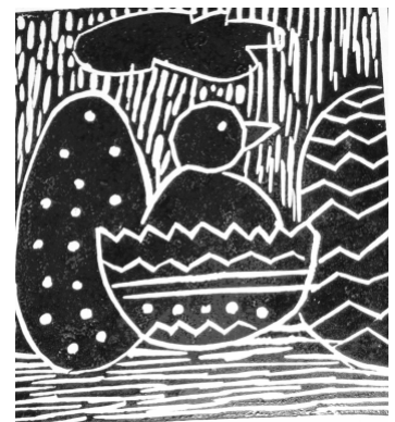
LINORYT WYKONAŁA KAJA PAJĄK, 13 LAT