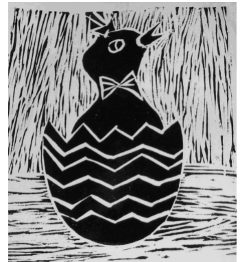
LINORYT WYKONAŁA ALEKSANDRA KOKOT, 13 LAT