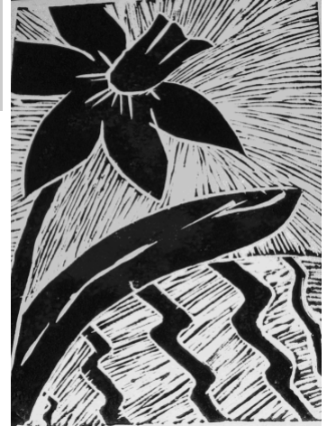
LINORYT WYKONAŁA KLAUDIA SIKORA, 13 LAT