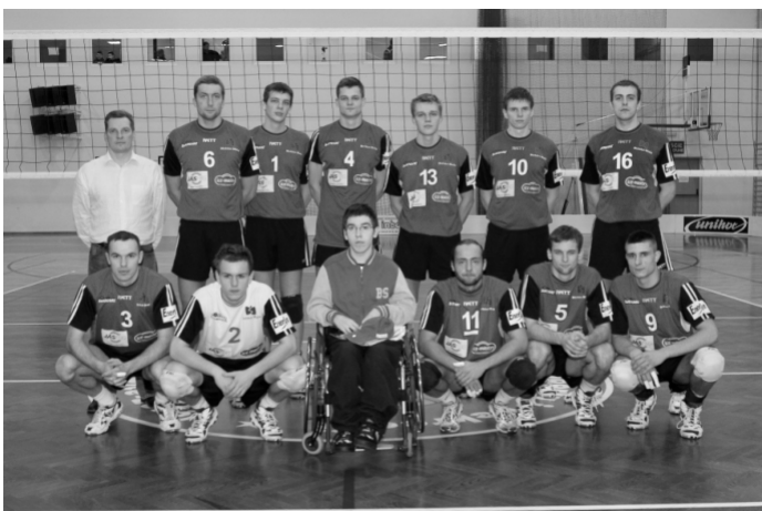
Na zdjęciu drużyna BBTS Włóknierz Bielsko-Biała