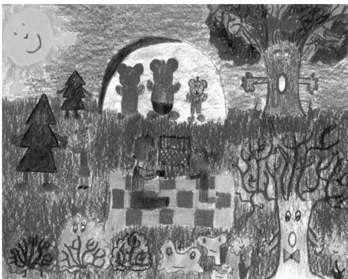
Projekt plastyczny: Karolina Hoza, kl. VIb, SP Nr 1 w Goczałkowicach-Zdroju