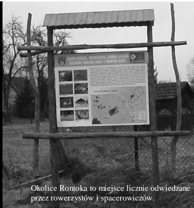
Okolice Rontoka to miejsce licznie odwiedzane przez rowerzystów i spacerowiczów.