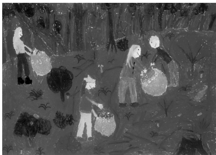
Projekt plastyczny: Oliwia Piłot, kl. IIIb, SP Nr 1 w Goczałkowicach-Zdroju