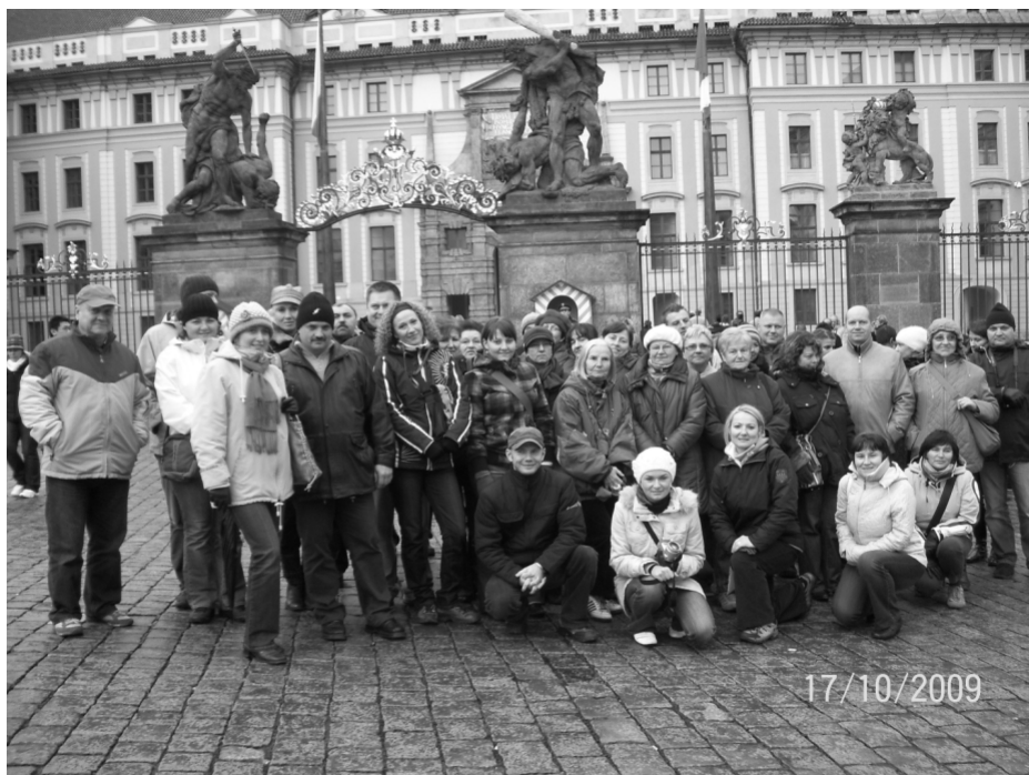
Pałac prezydencki na wzgórzu Hradczańskim

Historyczna „Złota Praga”, „miasto o stu wieżach” już od wieków zachwycała swym pięknem przybyszów i mieszkańców. Uznawana była za „perłę w cesarskiej koronie Habsburgów”. Johann Goethe nazwał ją „najcudowniejszym klejnotem w kamiennej koronie ziemi”. Nic więc dziwnego, iż kolejną propozycją Gminnego Ośrodka Kultury na wyjazd była czeska stolica. Organizatorzy wycieczki zgromadzili 46 osób, które 16 października o godzinie 5.00 rano wyjechały w stronę cieszyńskiego przejścia granicznego. Pierwszym punktem programu był Morawski Kras w pobliżu miasta Blansko, gdzie znajduje się jaskinia Punkewni oraz przepaść Macocha. Wprost ze Skalnego Młyna, turystycznym pociągiem podjechaliśmy pod wejście do odkrytej w latach 1909 do 1933 jaskini. Jej wnętrze zachwyca potężnymi kopułami i