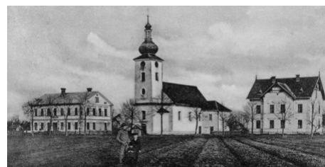
Fragment zabudowy starego Zarzecza - w tle kościół parafialny

Na dzień dzisiejszy z dawnego wielkiego Zarzecza pozostało 335 ha ziemi, 74 domy i ok. 330 mieszkańców, czyli jedna szóstą powierzchni, jedna piąta budynków i jedna dziesiąta mieszkańców. Pomimo to pamięć o zalanej wsi wciąż pozostaje żywa wśród jej dawnych mieszkańców i kolejnych