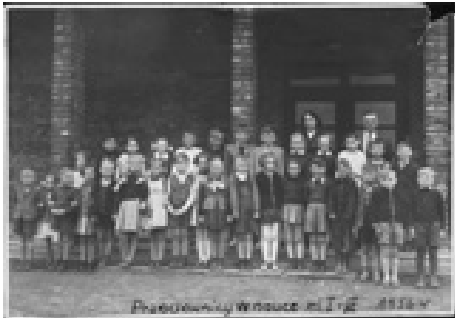
Uczniowie klas V-VII w latach 1955 - 1956

tycznie zwiększało się również grono pedagogiczne: w 1960 r. pracowało 14 nauczycieli, w 1968 r. 23, w 1978 r. 28, a w 1987 r. 36. Stan ten doprowadził, iż zaczęto myśleć o rozbudowie szkoły, albo o budynku dodatkowym. W efekcie w 1992 r. w budynku sanatoryjnym „Górnik” (dawny budynek „Spółki