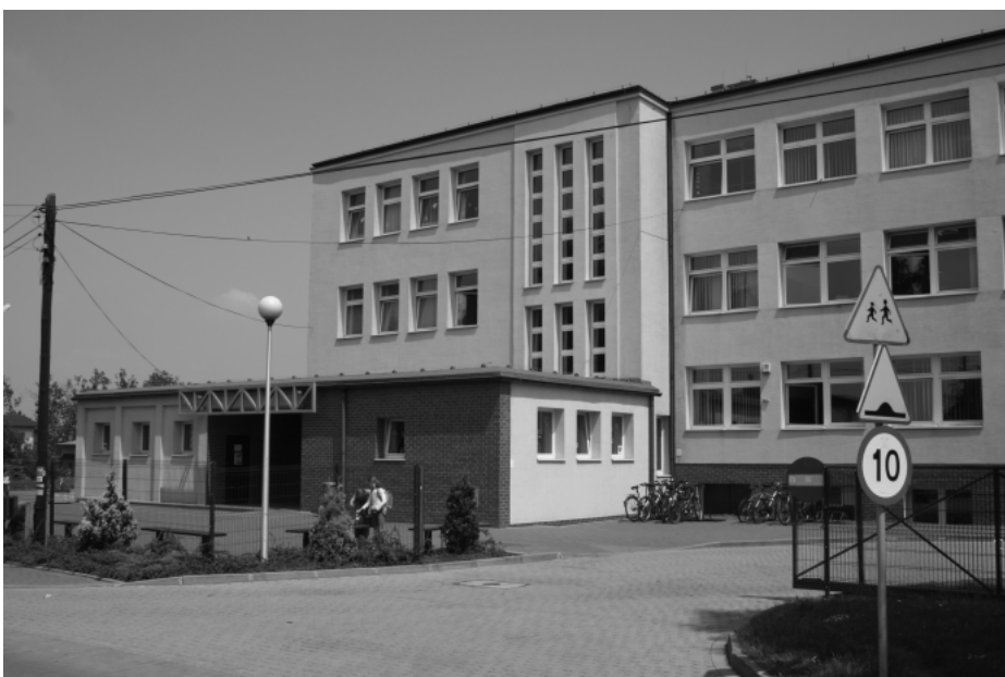
Szkoła Podstawowa nr 1 współcześnie

Goczałkowice leżące na terenie Górnego Śląska, wchodziły w skład