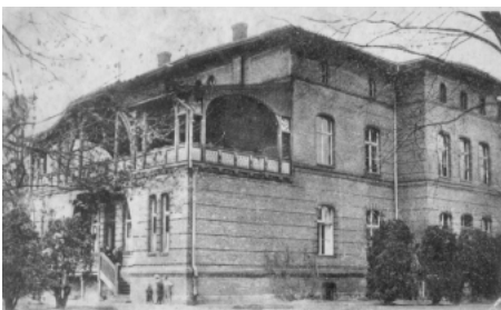
Budynek Spółki Brackiej, późniejsza Szkoła Podstawowa nr 2

pozostawało 96 dzieci, z czego tylko 55 regularnie uczęszczało na lekcje. Ważnym wydarzeniem była budowa w okolicach kościoła parafialnego, w 1819 r. nowej drewnianej szkoły. Budynek składał się tylko z jednej izby lekcyjnej i drugiej przeznaczonej na mieszkanie nauczycielskie. Niestety frekwencja dzieci uczęszczających do szkoły pozostawała wiele do życzenia. I tak w 1822 r. spośród 80 dzieci na lekcje przychodziło niewiele ponad 40. W dwadzieścia lat później ich liczba wynosiła 132, przy jednym nauczycielu, dlatego lekcje rozpoczynały się nawet o 4 rano. Dopiero w II połowie XIX w. liczba dzieci