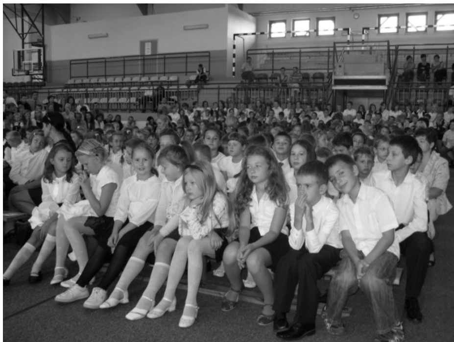
Uczniowie Szkoły Podstawowej nr 1 w trakcie uroczystego rozpoczęcia roku szkolnego 2009/2010