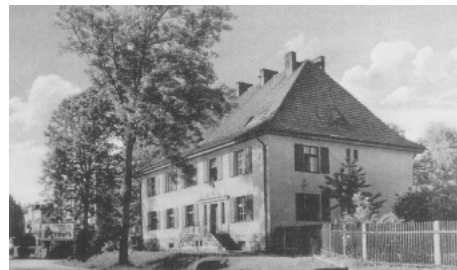
Niemiecki Urząd Gminy na pocztówce wysłanej w 1943 r.

Wraz z nadejściem 1945 r. i zakończeniem działań wojennych Goczałkowice starały się powrócić do życia z czasów poprzedzających 1939 r. Nieste-