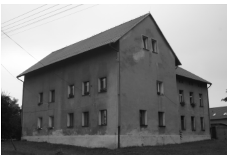
Budynek starej szkoły przy kościele parafialnym

„szkolnych” zaczęła wzrastać. W 1856 r. wynosiła 115, a w 1861 ok. 148. Wiązało się to z kolejnym, pilnie narastającym problemem – budynkiem szkolnym, który nie nadawał się już wówczas do użytku. Pierwsza murowana szkoła została wystawiona w 1870 r. i pomimo wybudowania nowej w 1910 r. (budynek ten stoi do dzisiaj, przy ul. Szkolnej i graniczy z kościołem św. Jerzego) służyła ona dzieciom, aż do II wojny światowej. W tym czasie uległ zmianie system organizacji szkoły, najpierw na trzyklasową, później cztero, a w 1912 r. na sześcioklasową z 313