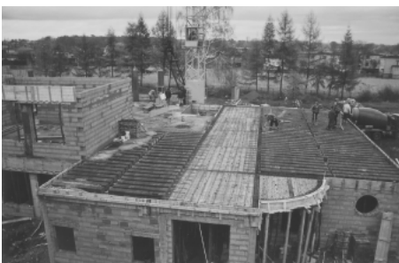
Gimnazjum w trakcie budowy

Minął 10 rok pracy Gimnazjum. Na kartach kronik szkolnych uśmiechają się uczniowie, którzy w roku szkolnym 1999/2000 rozpoczęli naukę w nowym systemie oświaty. 73 gimnazjalistów zajmowało wtedy 3 sale lekcyjne na II piętrze Szkoły Podstawowej nr 1. Rów-