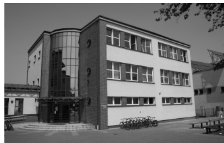
Aktualne zdjęcie Gimnazjum