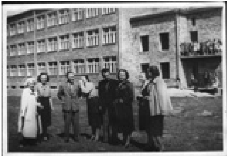
Szkoła Podstawowa nr 1 w latach '50

W trakcie lat 50 – tych i niemal całych 60 – tych liczba dzieci w wieku szkolnym nie przekraczała 500. Dopiero wraz z rokiem 1968 wzrosła do 720 i więcej nie spadła poniżej 700. Systema-