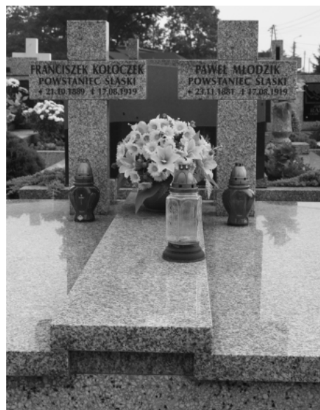
Mogiła Powstańców na cmentarzu parafialnym