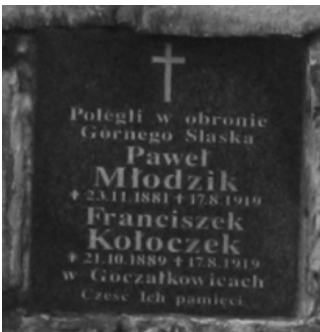
Tablica pamiątkowa przy Publicznym Przedszkolu Nr 1

Wskutek złego przygotowania, nieodpowiedniego terminu wybuchu oraz zdecydowanej przewagi liczebnej Niemców powstanie upadło. Pomimo to odwaga i chart ducha z jakim walczyli powstańcy na zawsze zapisała się w dziejach historii Polski.