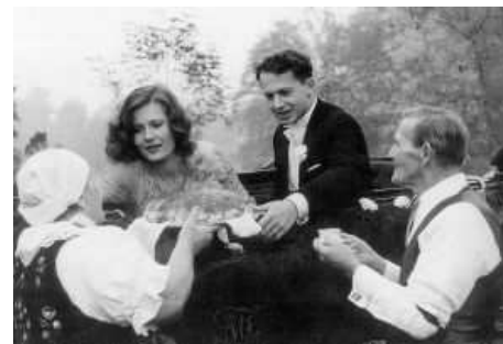
Kadr z filmu „Magnat” - na zdjęciu Pani Łucja z mężem

Pomimo licznej rodziny zawsze chętnie służyła innym pomocom i udzielała się na rzecz lokalnej społeczności. Pamięta, że nie zawsze lekko było jej sprostać codziennym obowiązkom, ale jak sama twierdzi, miała do swej pracy tyle serce, iż niejednokrotnie „wolała nie iść spać,