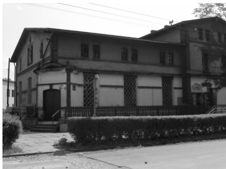
Dawna restauracja „u Stroncza”