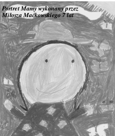
Portret Mamy wykonany przez Miłosza Maćkowskiego 7 lat