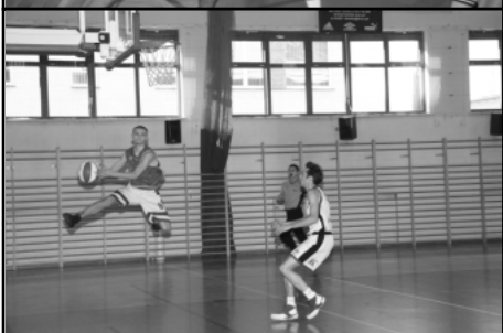
Zdjęcia z Mistrzostw Śląska