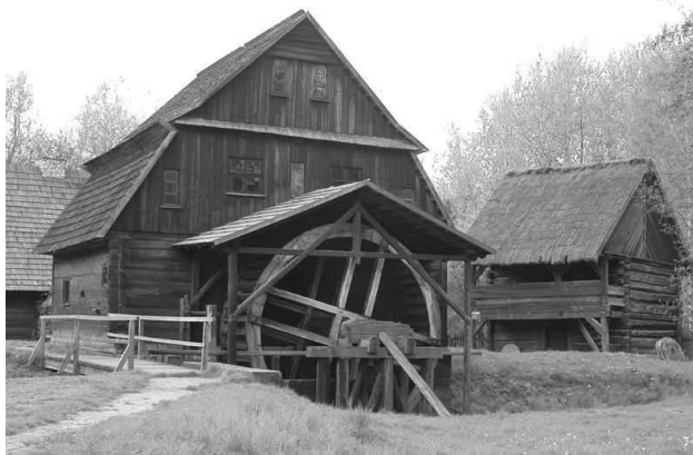
Młyn wodny - według dawnej architektury drewnianej