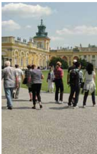
Pałac w Wilanowie.

W spółczesna Warszawa, to miejsce niezwykle pod wieloma względami. Mocno okaleczone przez historię, od ponad siedemdziesięciu lat walczy o odzyskanie dawnego splendoru i piękna. Z lepszym i gorszym skutkiem podnosi się z gruzów przeszłości. Odbudowuje zabytki, boryka się z urbanistyczną wizją