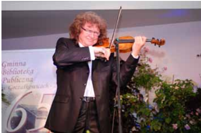
Koncert Zbigniewa Wodeckiego.