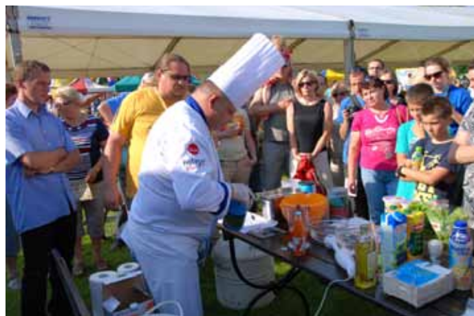
Pokaz kuchni molekularnej.