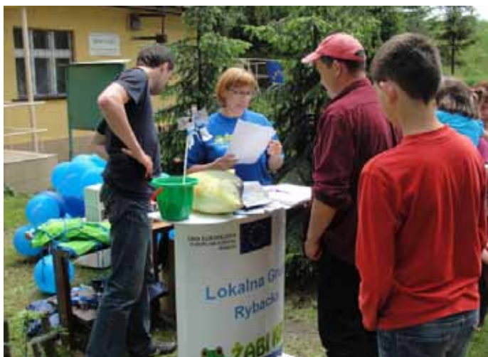
Stoisko promocyjne Lokalnej Grupy Rybackiej „Żabi Kraj”.