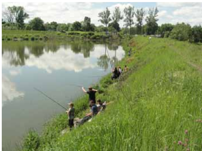
Zawody Sławikowe na stawie „Rontok Mały”.

O tym, wyjątkowym dniu nie zapomniano również w Goczałkowicach. Specjalnie dla wszystkich dzieci, 2 czerwca na stawie „Rontok Mały” odbyły się Sławikowe Zawody Wędkarskie zorganizowane przez Stowarzyszenie Wędkarskie „Rontok”, Lokalną Grupę