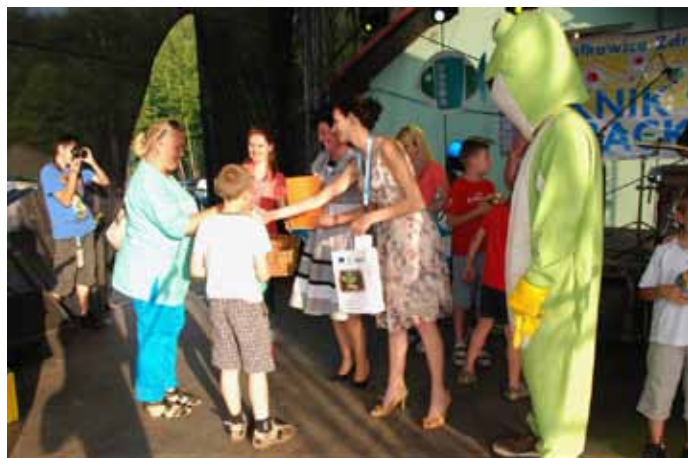
Wręczenie nagród w ramach konkursu - RODZINNE POTYCZKI.

W ramach pikniku, którego celem było promowanie działalności stowarzyszenia (szczegółowe informacje można było pozyskać na stoisku promocyjnym LGR) przygotowano szereg różnorodnych atrakcji. Na dużej scenie, o godz. 14.00 rozpoczął się program artystyczny w ramach któ-