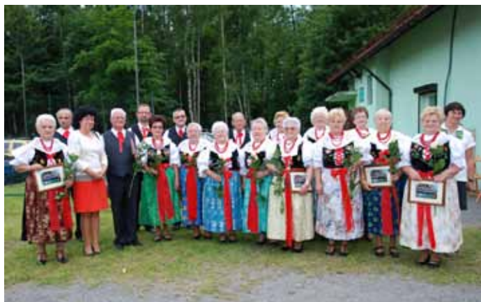
Jubileusz 65-lecia Zespołu Folklorystycznego Goczałkowice.