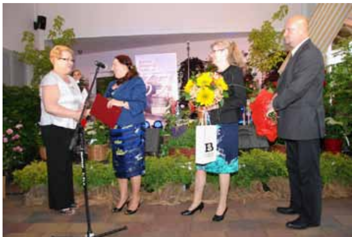
Przewodniczący Rady Gminy oraz przedstawicielki Biblioteki Śląskiej.