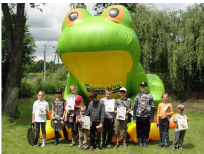
Grupa zwycięzców z pamiątkowym dyplomem.