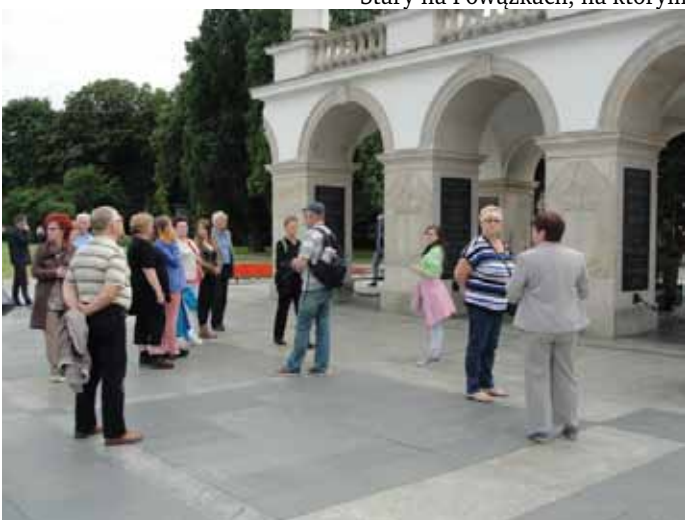
Grób Nieznanego Żołnierza.

PRL-u oraz wychodzi naprzeciw dzisiejszym stylom i wzorcom.