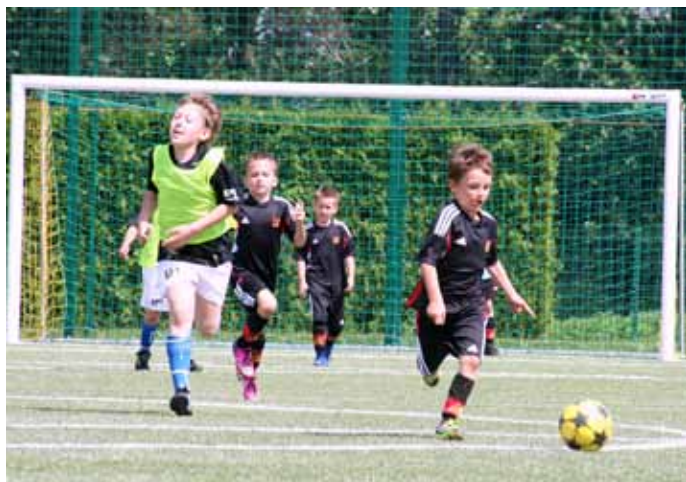
cię w swoim turniejowym debiucie zajęli gospodarze zawodów

W niedzielę, 16.06.2013r. na goczałkowickie boisko piłkarskie „Orlik” wybiegli najmłodszy piłkarze, a dokładnie żaki, aby rywalizować ze sobą w „Turnieju piłki nożnej o puchar Kierownika Gminnego Ośrodka Sportu i Rekreacji”. Do zawodów zgłosiło się pięć drużyn, które grały ze sobą systemem „każdy z każdym”. Pierwsze miejsce zajęli wspomniani wcześniej zawodnicy Drzewiarza Jasienica, na miejscu drugim uplasowała się drużyna UMKS Trójka Czechowice – Dziedzice I, ostatnie miejsce na podium trafiło na konto Szkółki Piłkarskiej z Brzeszcz, czwartą pozycję