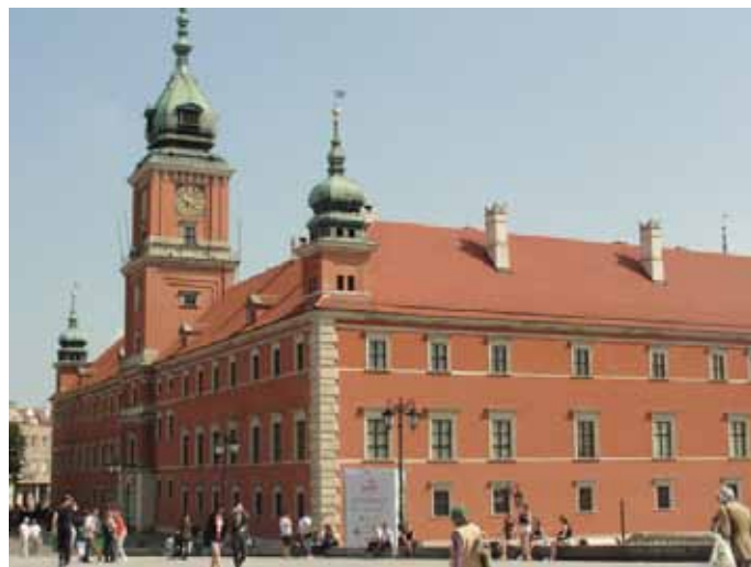
Zamek Królewski w Warszawie.

Tereny dawnego Getta Żydowskiego oraz Cmentarz Stary na Powązkach, na którym