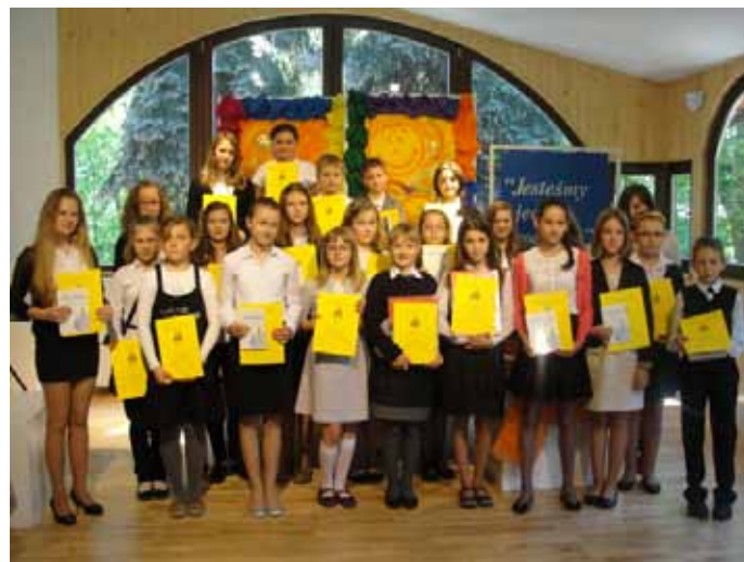
Uczestnicy konkursu recytatorskiego „Jesteśmy Jedną Rodziną”.

N a goczałkowickiej scenie, we wtorkowe przedpołudnie wystąpiło 24 uczniów, reprezentujących cały Powiat Pszczyński. Wśród recytowanych tekstów znalaz-