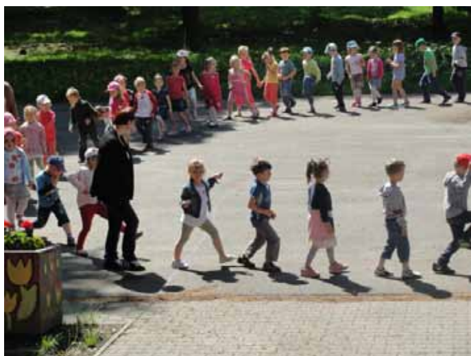
Dzieci z Publicznego Przedszkola nr 1 w Goczałkowicach-Zdroju.