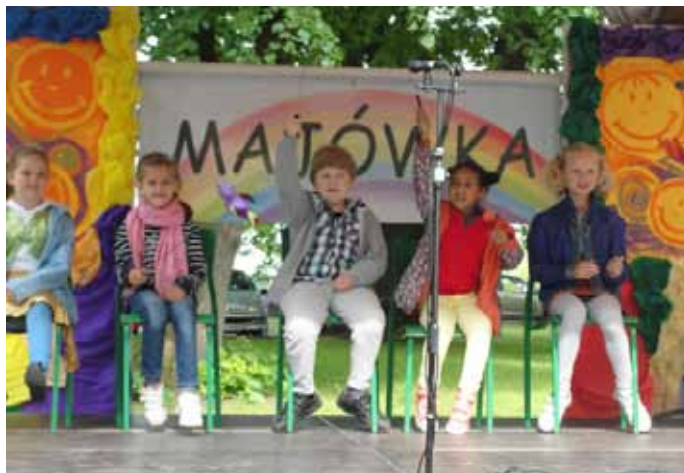
Dzieci z warsztatów teatralnych.

W sobotę, 25 maja przy siedzibie Gminnego Ośrodka Kultury w Goczałkowicach-Zdroju odbyła się trzecia Rodzina Majówka. W ramach imprezy na boisku przy budynku „Górnik” swe umiejętności zaprezentowały dzieci i młodzież uczęszczające na warsztaty tematyczne instytucji oraz rozdano nagrody i wyróżnienia w konkursie plastycznym „Portret Mojej Mamy” (łącznie na konkurs wpłynęło 689 prac).