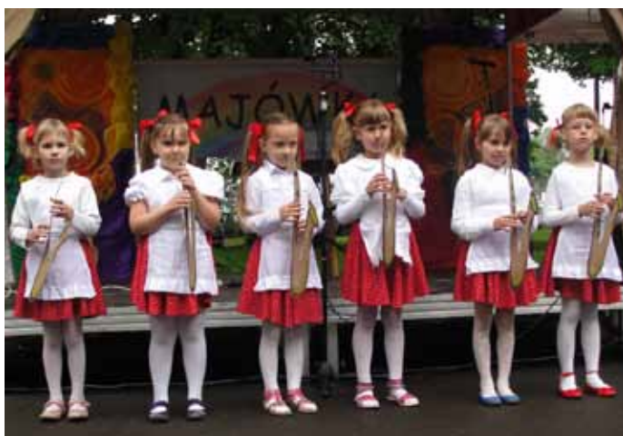
Warsztaty taneczne - grupa młodsza.