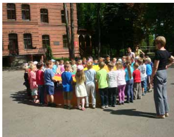
Dzieci z Publicznego Przedszkola nr 2 w Goczałkowicach-Zdroju.

Rok 2013 został ogłoszony rokiem Juliana Tuwima, dla-