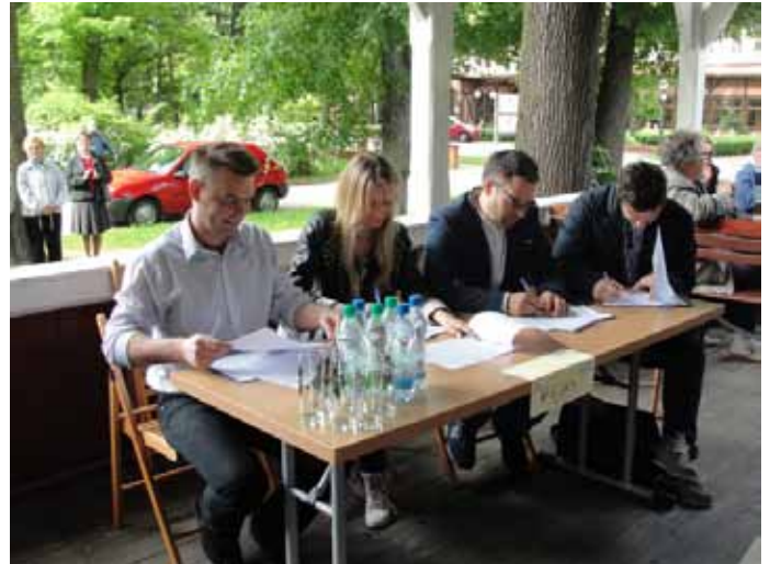
Jury w trakcie obrad.

Uczestnicy według regulaminu zaprezentowali licznie zgromadzonej widowni po dwa utwory – jeden z repertuaru Jacka Lecha oraz drugi, dowol-