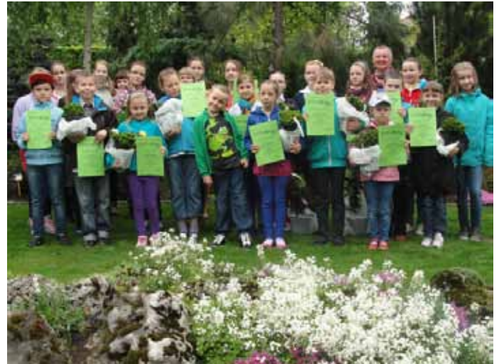
Laureaci konkursu „Święto Polskiej Niezapominajki”.

Polska Niezapominajka odbiła się szerokim echem również w lokalnych środowiskach.