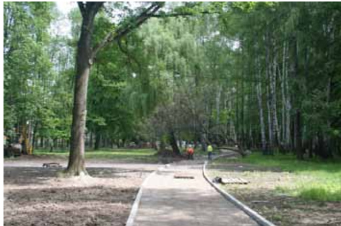
Rewitalizacja Parku Uzdrawiskowego.

-dokończenie budowy ścieżek edukacyjno -przyrodniczo-wypoczynkowych poprawiających układ komunikacyjny w parku