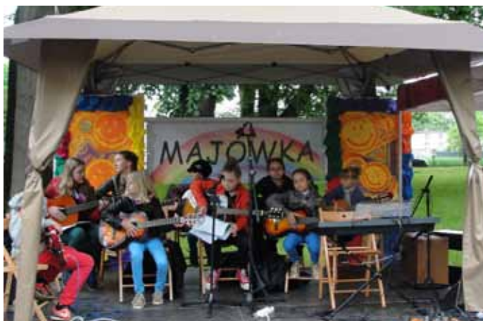
Występ młodzieży z warsztatów muzycznych GOK-u.

GMINNY OŚRODEK KULTURY w Goczałkowicach-Zdroju zaprasza na kulturoznawczy wyjazd