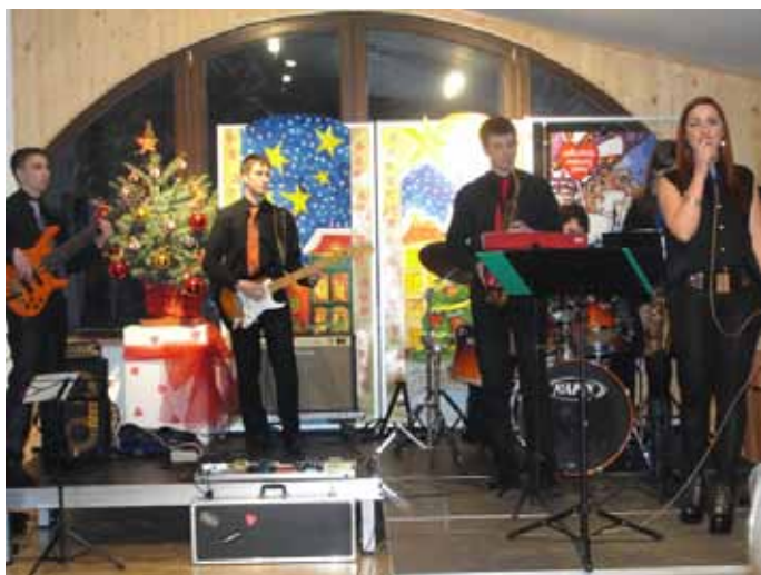
Zespół Smoogi Band podczas XXI Finału WOŚP.

nego, że co roku, w całym kraju powstaje coraz więcej nowych sztabów, gotowych zbierać pieniądze na rzecz najbardziej potrzebujących. W tym roku utworzono ich aż 1800.