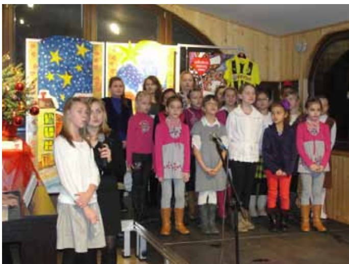
Dzieci z zespołu Pszczyńskiego Ogniska Pracy Pozaszkolnej.