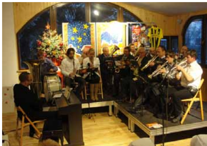
Występ Goczałkowickiej Orkiestry Dętej.