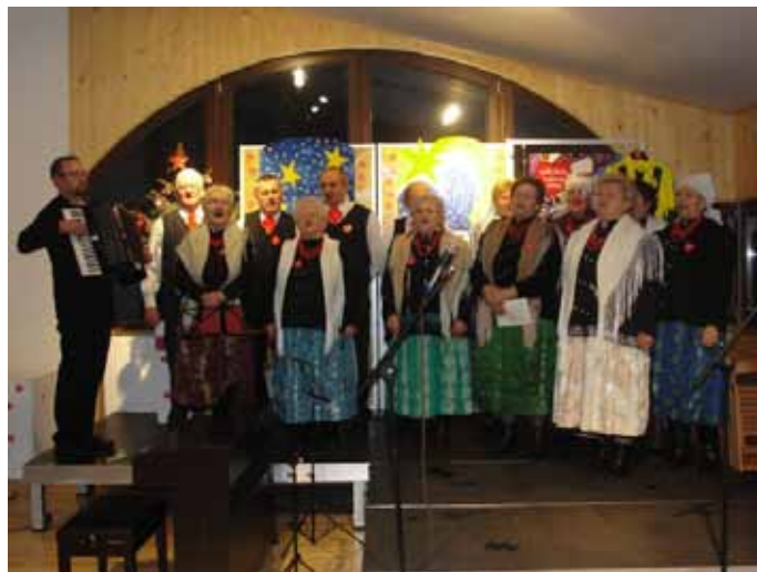
Występ Zespołu Folklorystycznego Goczałkowice.

Nie wiele osób ma świadomość, że w Polsce istnieje zale-