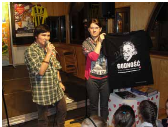
Licytacja limitowanej koszulki WOŚP z wizerunkiem Alberta Einsteina.