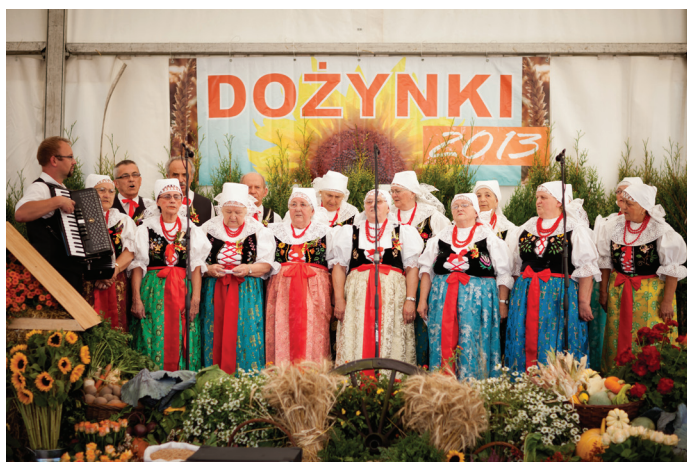
Występ Zespołu Folklorystycznego Goczałkowice.