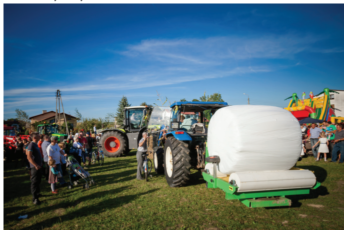
Wystawa maszyn rolniczych.