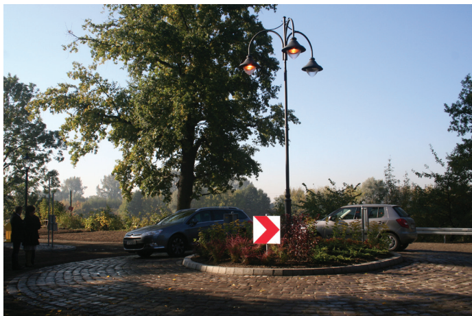
Nowe rondo na skrzyżowaniu ul. Zielonej i ul. Uzdrowskiej.