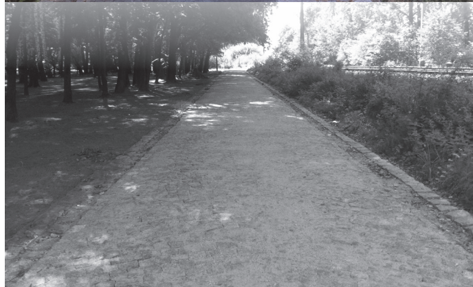
Fragment przebudowanej ul. Parkowej.

głego roku oraz dotację w kwocie 1.071.580 zł. z budżetu państwa w ramach Narodowego Programu Przebudowy Dróg Lokalnych czyli tzw. „schetynowek”.