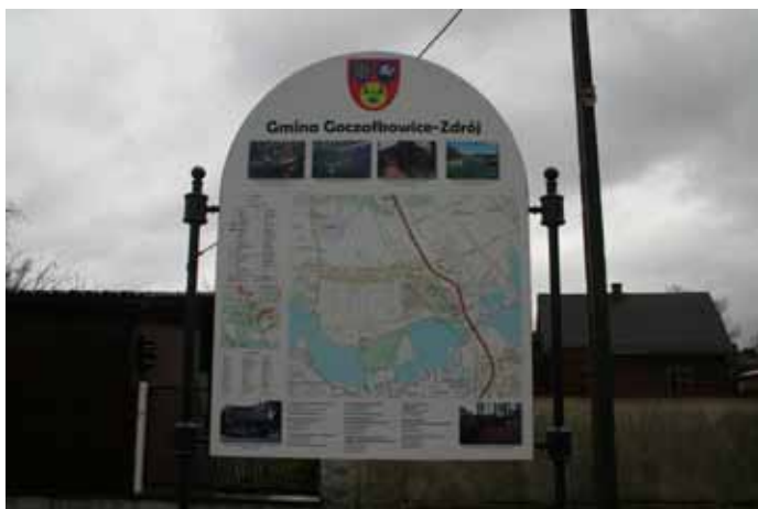
Tablica informacyjna przy ul. Uzdrawiskowej.

Zakres obejmował zakup i montaż tablic informacyjnych z planem miejscowości, wykonanie strony internetowej (www.turystyka.goczałkowicz-zdroj.pl), wykonanie systemu informacji sms, wykonanie folderu pt. „Przewodnik Gmina Goczałkowice-Zdrój”. Całkowity koszt zadania poniesiony w latach 2012-2013 to 43.134 zł.