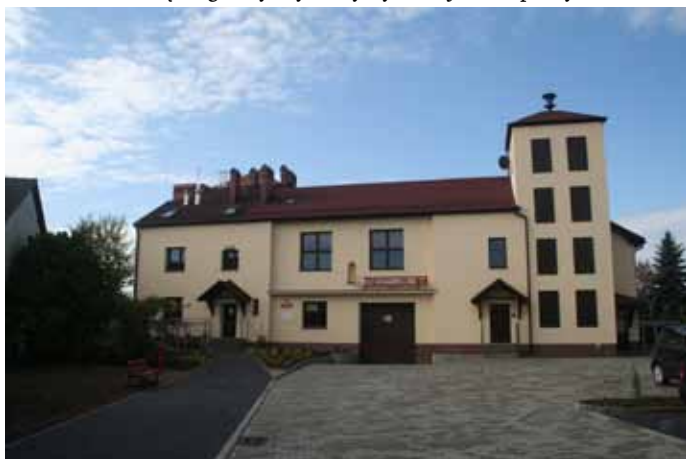
Wyremontowany budynek Urzędu Gminy.

II. Projekt "Termomodernizacja budynku Urzędu Gminy Goczałkowice-Zdrój i remont obiektu". Środki na jej częściowe sfinansowanie pozyskano w 2012r. w postaci pożyczki z Wojewódzkiego Funduszu Ochrony Środowiska i Gospodarki Wodnej w Katowicach w wysokości 62 tys. zł oraz dotacji z WFOŚiGW w wysokości 6 tys. zł. Inwestycja została rozpoczęta w 2012r. W 2013r. poniesione na to zadanie wydatki wyniosły 620 tys zł. W ramach zadania wykonano również wjazd do OSP i OPS od ulicy Szkolnej oraz wykonano remont sali urzędu gminy wykorzystywanej na imprezy okoliczno-