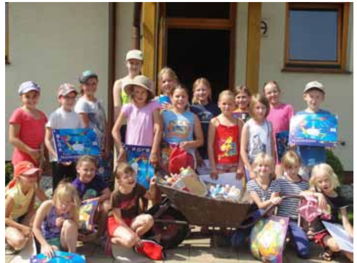
Uczestnicy Pleneru Plastycznego w Górkach Wielkich - 2011.

najmłodszych, zarówno tych plastycznych, jak i recytatorskich. Do pierwszej kategorii należy zaliczyć: „Portret Mojej Mamy”, „Święta Bożego Narodzenia w moim domu, gminie regionie” oraz tzw. Niezapominajkę (konkurs współorganizowany przez Gospodarstwo Szkółkarskie KAPIAS, którego znaczenie związane jest z ocaleniem od zapomnienia ważnych dla nas chwil, miejsc i ludzi). W drugiej, znajdzie się niezwykle popularny w Powiecie Pszczyńskim konkurs gwarowy „Pogodźmy po naszymu”, skierowany do uczniów klas II i II Szkół Podstawowych oraz konkurs recytatorski „Jesteśmy jedną rodziną”.