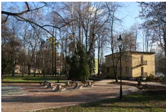
Park zdrojowy po zakończonej rewitalizacji.

I. Projekt pn. "Poprawa atrakcyjności rekreacyjno-turystycznej Gminy Uzdrawiskowej Goczałkowice-Zdrój poprzez rewitalizację zabytkowego parku zdrojowego", który sfinansowano przy udziale środków z Programu PO RYBY pozyskane w wyniku konkursu ogłoszonego przez Stowarzyszenie LGR Zabi Kraj. Dotacja z Unii Europejskiej wynosi 1.058.tys.zł. Na nasadzenia pozyskano również dotację z Wojewódzkiego Funduszu Ochrony Środowiska i Gospodarki Wodnej w Katowicach, w wysokości 130 tys.zł. Wydatki na zadanie poniesione w 2013r. to 2.503.264 zł..