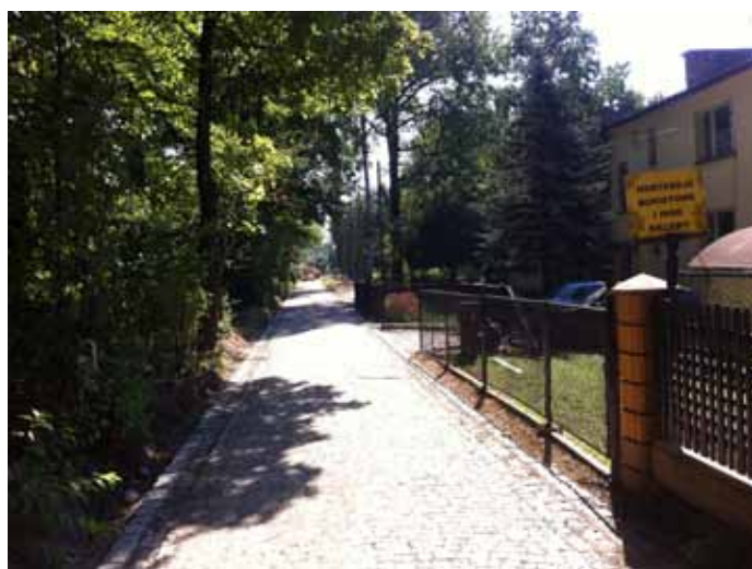
Ul. Parkowa po zakończonej przebudowie.

ściowe, spotkania czy posiedzenia rady gminy III. Budowa drogi gminnej ulicy Parkowej oraz ulicy Uzdrawiskowej na odcinku od ul. Parkowej do granicy Powiatu. Wydatki na to zadanie wyniosły 2.218 tys.zł. Inwestycja była sfinansowana dotacją z budżetu państwa w ramach Narodowego Programu Przebu-