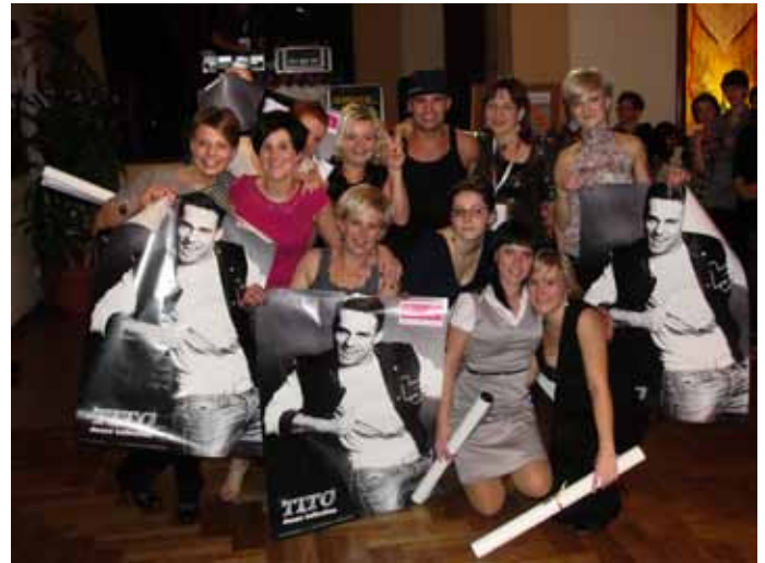
BABSKI COMBER 2012

Należałoby, powoli postawić kropkę nad „i”, ale zanim to nastąpi warto napisać parę zdań o naszych konkursach dla