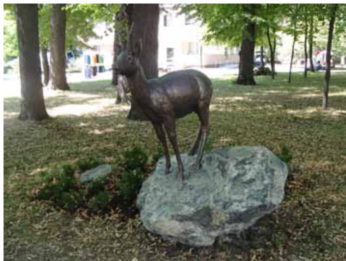
Koziołek Samy w goczałkowickim uzdrowisku.