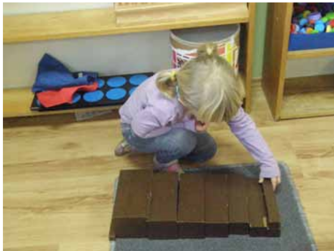
Brązowe schodki wg. M. Montessori.

Główne założenia Montessori: uczenie poprzez działanie, tworzenie takiego otoczenia, by dziecko było skupione, prowa-