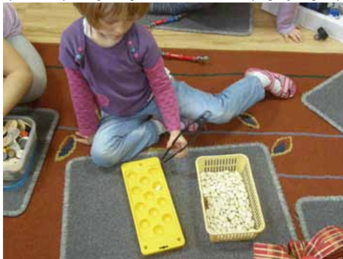
Liczeni i ćwiczenie chwytu pensetkowego.

materiały z konferencji Nauczycielka Publicznego Przedszkola nr 1 M. Rak