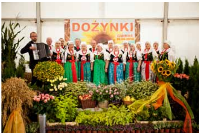
Występ Zespołu Folklorystycznego - DOŻYNKI 2012.

W tym roku, do tego jakże znacznego grona dołączyły kolejne dwa, autorskie przedsięwzięcia GOK-u. Pierwsze, to zorganizowany w maju (przy współpracy z miejscowym uzdrowiskiem) Festiwal Piosenki Jacka Lecha – popularnego w latach 60-tych i 70-tych XX w. polskiego wokalisty (starsi mieszkańcy gminy być może pamiętają jego występy na werandzie kawiarni uzdrowskiej). Drugie, to dwudniowa, lipcowa impreza nosząca niebanalną nazwę – Festiwal Róż, której meritum związane jest z bogatą tradycją uprawy kwiatów i roślin na terenie Goczałkowic. W skład jej kompozycji weszła wystawa, kwiatów, pokazy i warsztaty florystyczne, koncert chórów z okolicznych miejscowości oraz występ gwiazdy większego wymiaru. Do udziału w tegorocznej, I edy-