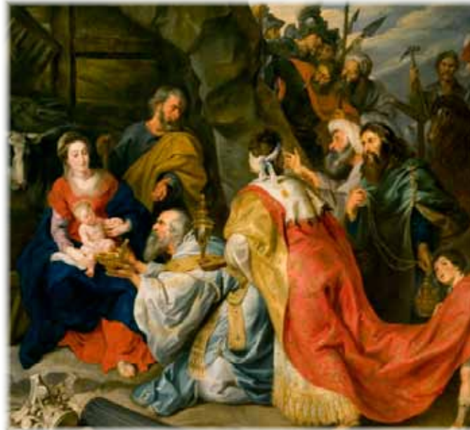
Pokłon Trzech Króli.

Ewangelia św. Mateusza przytacza historię, która miała wydarzyć się za panowania króla Heroda. Do Betlejem w niedługim czasie po narodzeniu Jezusa, przybyli mędrcy ze wschodu, którzy odnaleźli dziecko w stajence, oddali mu pokłon i złożyli dary – „Tuż przed przyjściem Chrystusa na świat Mędrcy ze Wschodu ujrzeli wśród gwiazd znak zapowiadający narodziny króla żydowskiego. Natychmiast wyruszyli w drogę, aby złożyć Mu hołd”.