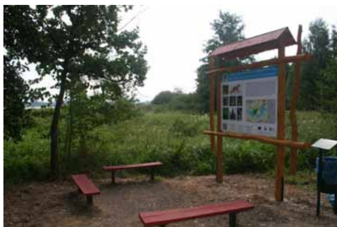
Odtworzone oznakowanie ścieżki edukacyjnej w Borze.

1. „Odtworzenie oznakowania i promocja dziedzictwa przyrodniczego Goczałkowic-Zdroju”. W ramach projektu wykonano 4