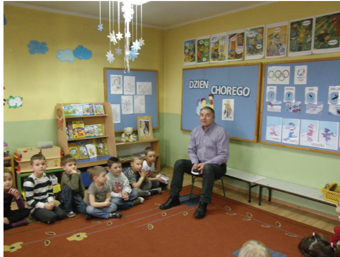
Spotkanie z pracownikiem hospicjum o.Pio w Pszczynie

Obchodzony 11 lutego ŚWIĄTOWY DZIEŃ CHOREGO, który został ustanowiony przez Jana Pawła II, to dobry moment, by poruszyć z dziećmi problem niepełnosprawności i choroby. W związku z tym przedszkolaki z Publicznego Przedszkola nr 1 uczestniczyły w zajęciach poświęconych temu problemowi. Ich celem było uświadomienie najmłodszym, że wśród nas są osoby chore, potrzebujące pomocy. Ponadto miały zachęcić do niesienia im pomocy, by nie być obojętnym na cierpienie innych. Dzieci przy pomocy historyjek obrazkowych, opowiadań poznały i wczuwały się w odczucia chorych i cierpiących.