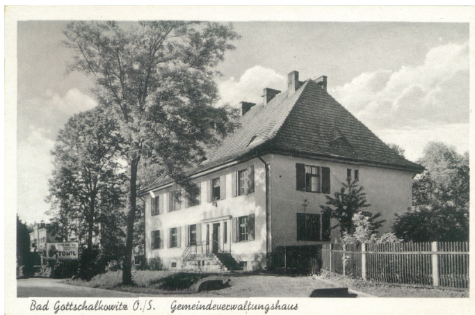
"Niemiecki Urząd Gminny" na pocztówce z 1943 roku.

gmina przekazała część budynków zdrojowych na potrzeby funkcjonowania samorządu oraz na lokale socjalne dla mieszkańców wsi. Przysłowiowym „gwoździem do trumny” dla goczałkowickiego kurortu było włączenie do nowych granic kraju regionu Dolnego Śląska, a wraz z nim kilku popularnych uzdrowisk, m.in. Polanicy-Zdrój, Szczawnicy-Zdrój itp. Fakt ten sprawił, że prawie zupełnie zapomniano o małym ośrodku leczniczym na południu Polski.