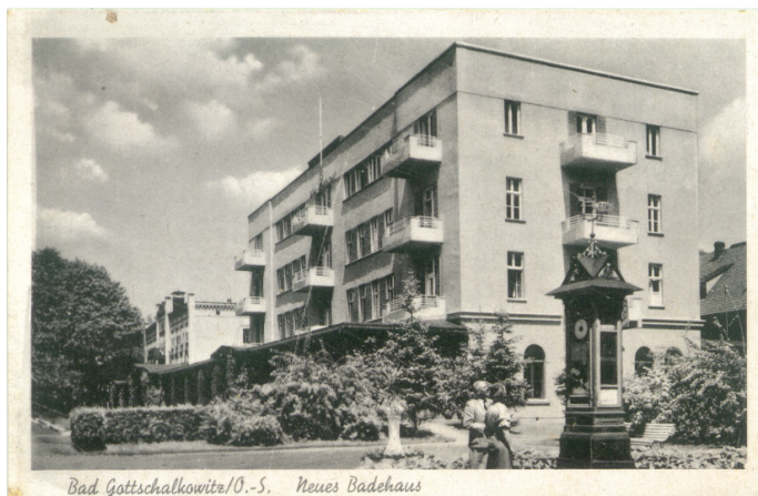
"Nowy Dom Zdrojowy" po przebudowie na pocztówce pochodzącej z lat 40-tych XX w.