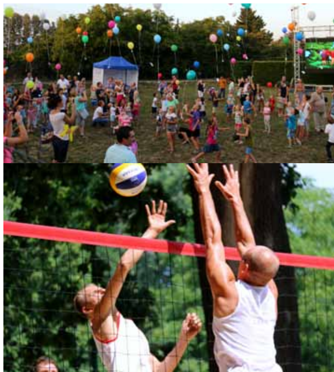
Sportu i Rekreacji w Goczałkowicach – Zdroju. ▲

Organizatorem sportowych wakacji był Gminny Ośrodek