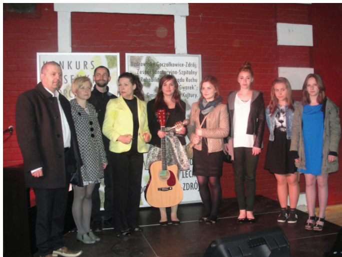
Uczestnicy konkursu im. Jacka Lecha.

Nawiązując do tych wydarzeń Gminny Ośrodek Kultury, 24 maja 2015 r. po raz kolejny zaprosił artystów do udziału w przeglądzie, zorganizowanym na tarasie restauracji uzdrowiskowej.