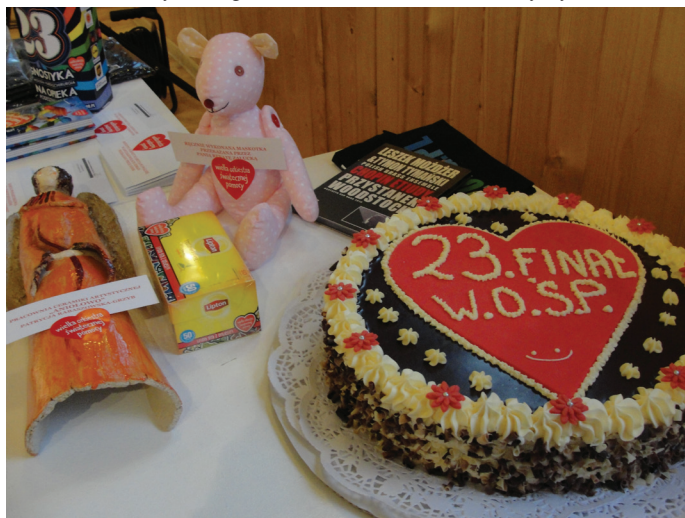
Przedmioty i dary przekazane na aukcję WOŚP.