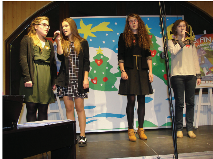
Prezentacja młodzieży z Powiatowego Ogniska Pracy Pozaszkolnej w Pszczynie.