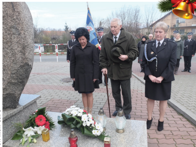
Uroczyste złożenie kwiatów pod pomnikiem "Ku czci poległych...".