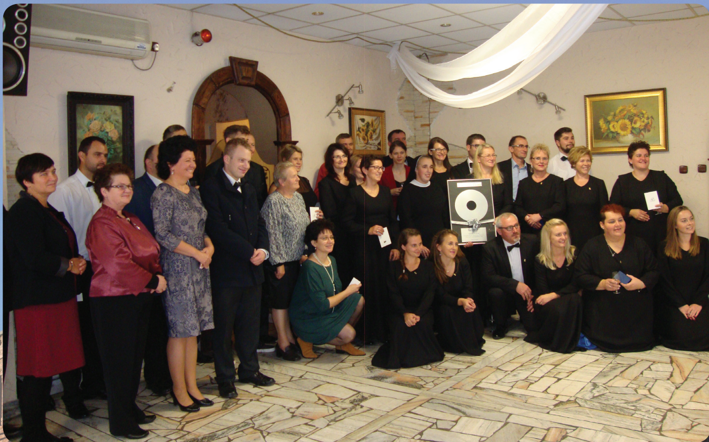
20-sto lecie chóru parafialnego Semper Communio.