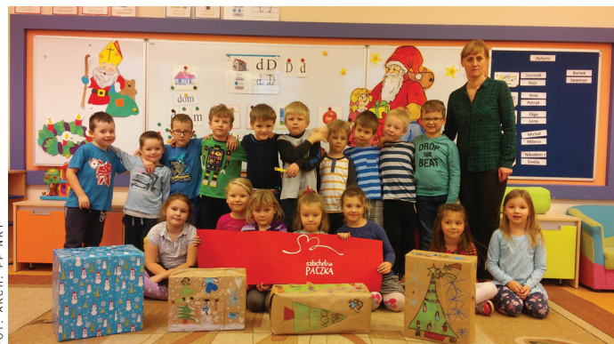
FOT. ARCH. - PP NR1