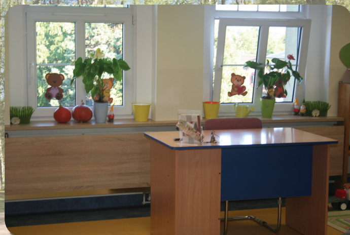
Remonty w SP1 i PP nr 1.