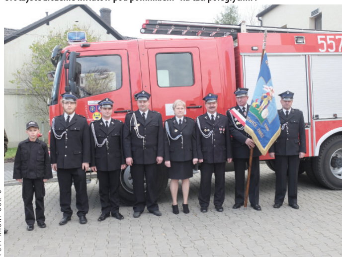
Przedstawiciele goczałkowickiej Ochotniczej Straży Pożarnej.