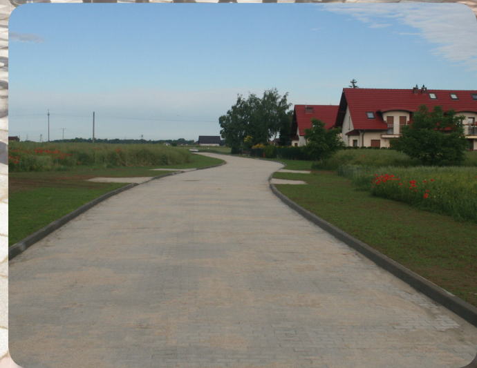
Przebudowa ul. Rzemieślniczej.