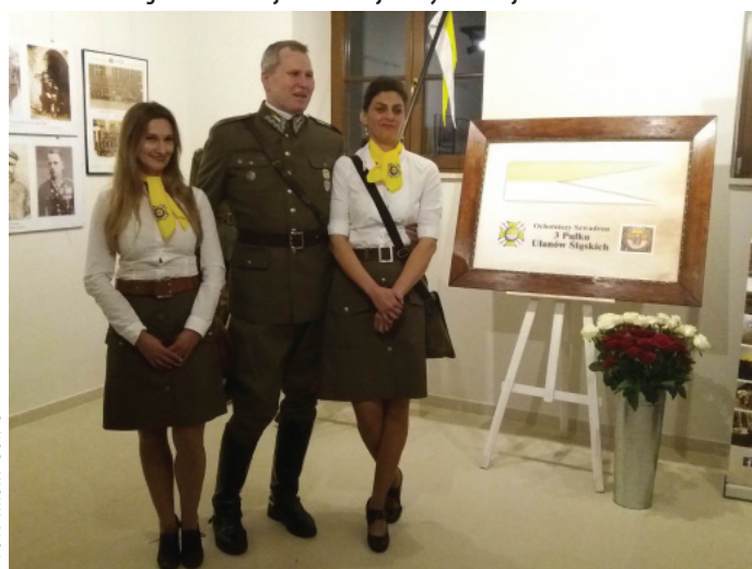
Wystawa 3 Pułku Ułanów Śląskich w galerii "Starego Dworca".