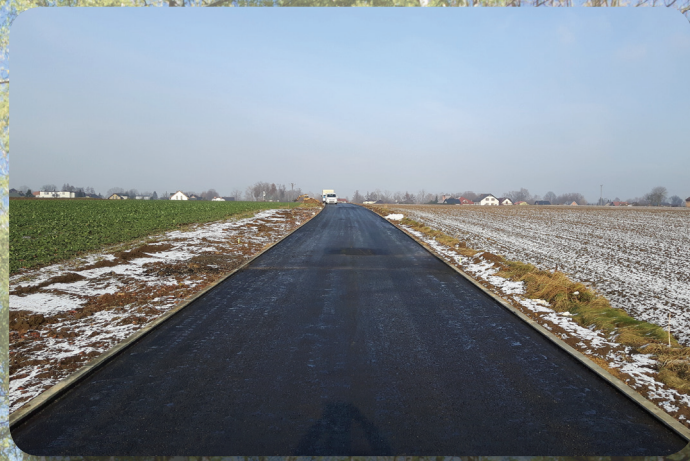
Przebudowa ul. Bór I.