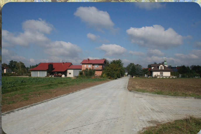
Przebudowa bocznej odnogi ul. Szkolnej.

Łącznie, kwota przeznaczona na gminne inwestycje wyniosła 1.648.139,30 zł.