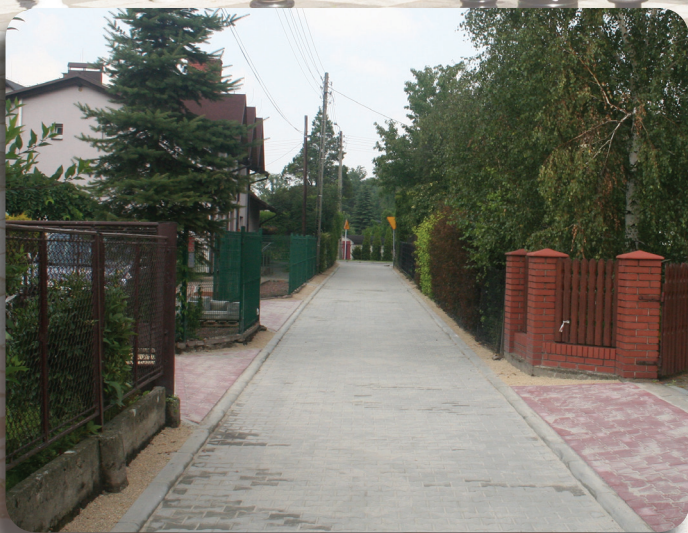
Przebudowa ul. Krótkiej.