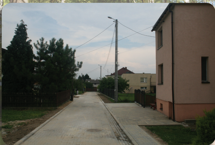
Przebudowa ul. Melioracyjnej.