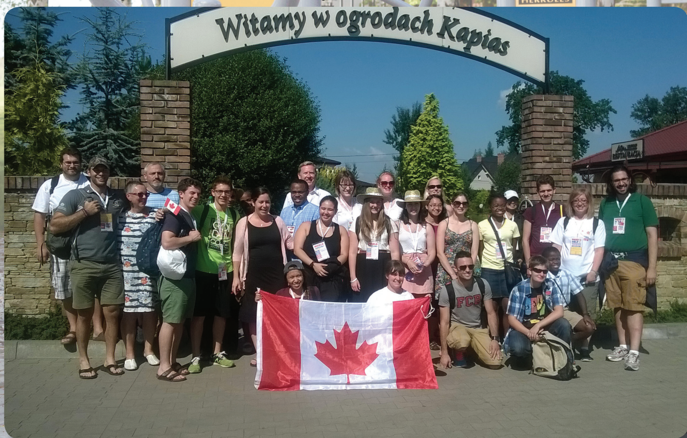
Światowe Dni Młodości – wizyta pielgrzymów z Kanady.