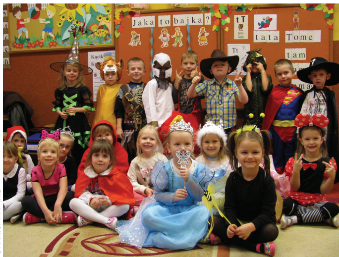
FOT. ARCH. - PP NR2

Dzieci we wszystkich grupach wiekowych wybrały się w magiczną podróż do krainy bajki, gdzie została poddana próbie ich wiedza na temat znajomości bajek i baśni. Podczas wyprawy prezentowały swoje stroje oraz omawiały z jakiej bajki do nas przybyły. Następnie na dzieci czekało sporo wyzwań