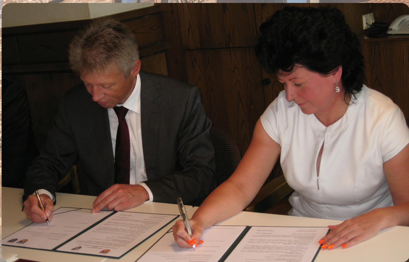
Podpisanie umowy partnerskiej z gminą Plossberg.