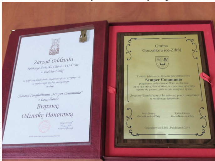
Od lewej: Odznaczenie PZCH i O, od prawej: dyplom przekazany przez Wójta i Radę Gminy.