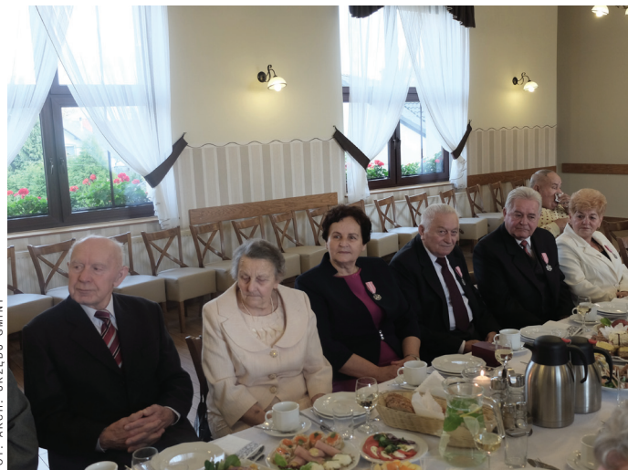
Pary obchodzące rocznicę 50 i 60 lat pożycia małżeńskiego na uroczystym spotkaniu.

Podsumowując rozmowę, podkreślili, że spotkanie, w którym dzisiaj mogą uczestniczyć, całe przyjęcie i atmosfera sprawia, że są ogromnie