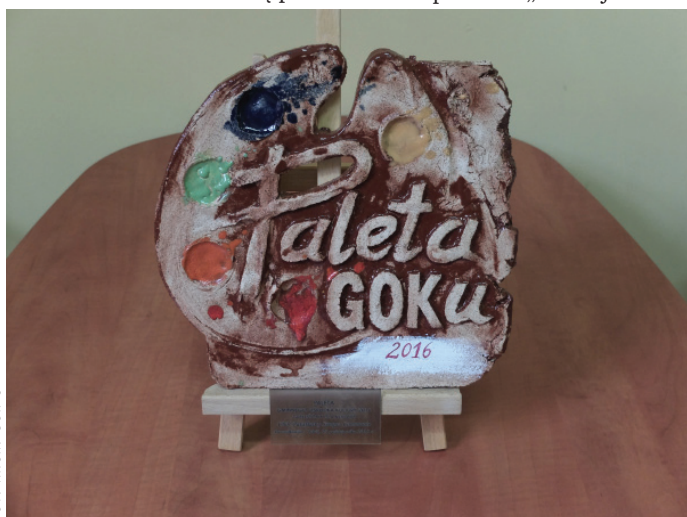
Paleta GOK-u 2016 "Zasłużony dla kultury" dla chóru Semper Communio.