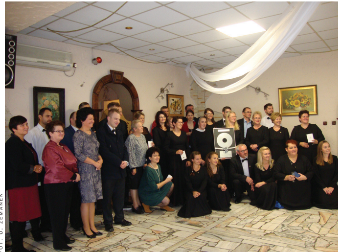
Pamiątkowe zdjęcie chórzystów z Wójta Gminy i zaproszonymi gośćmi.

Zarząd bielskiego oddziału związku postanowił także, wręczyć Honorowe Odznaki, które otrzymuje się m.in. za wyjątkowe osiągnięcia kandydata oraz jego wieloletnią działalność w zespołach artystycznych, najbardziej zasłużonym chórzystom. Legitymację Brązowej Odznaki nadawaną po 5 latach aktywnego członkostwa