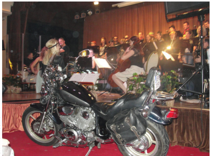
Jedna z większych niespodzianek koncertu - motor - zapowiedź rockowej części koncertu.

ma, Ja nie przestaję śpiewać – To moja sutra serca...” doskonale oddały ducha z jakim od lat wszyscy chórzyci angażują się w działalność zespołu.