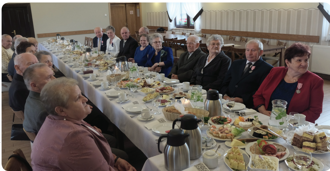
Pary obchodzące rocznicę 50 i 60 lat pożycia małżeńskiego na uroczystym spotkaniu.