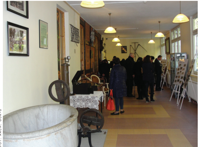
Sala wystawowa Muzeum Regionalnego w pawilonie Wrzos.

Założyciele i pomysłodawcy muzeum regionalnego, podkreślają, że ich inicjatywa związana jest z promowaniem historii oraz lokalnego dziedzictwa, a zgromadzone na wystawie