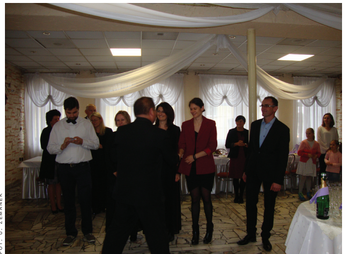
Wręczenie Honorowych Odznaczeń.