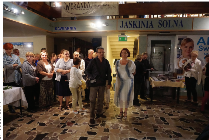
Wernisaż wystawy Fotografii Ojczyściej w galerii WERANDA.