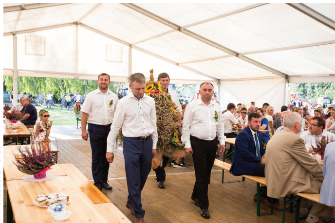
Wniesienie Korony Dożynkowej na miejsce uroczystości.

W Goczałkowicach-Zdroju żniwne święto zaplanowano na ostatnią sobotę wakacji. Obchody, rozpoczęły się 27 sierpnia o godz. 15.00 mszą św. w kościele parafialnym, której przewodniczył ks. Proboszcz Lesław Przepłata. Na miejsce uroczystości obrzędowych po raz kolejny wybrano łąkę, zlokalizowaną w sąsiedztwie baru