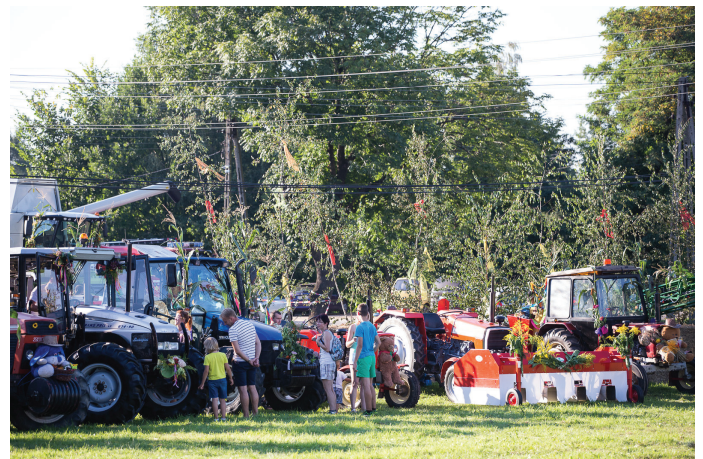
FOT. GRZEGORZ KOPEĆ