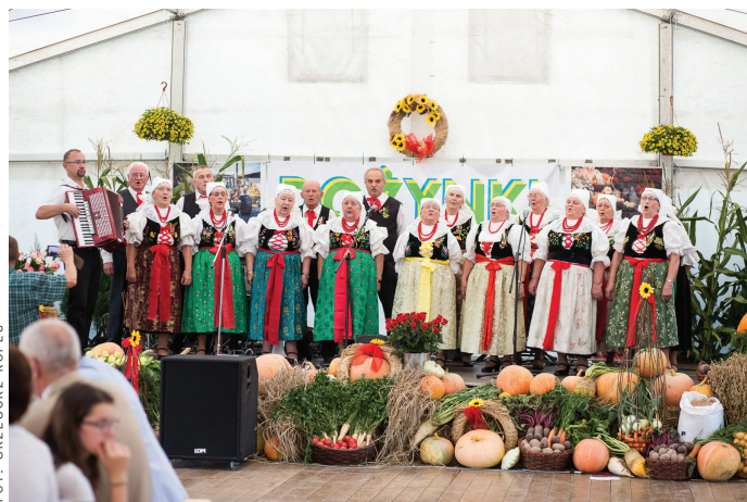
Występ Zespołu Folklorystycznego Goczałkowice/