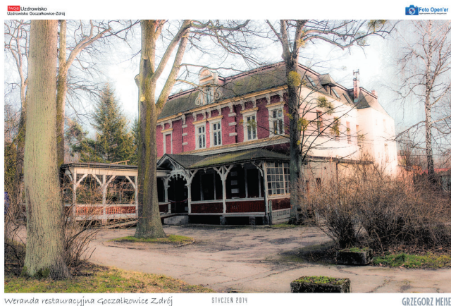
Weranda restauracyjna Goczałkowice Zdrój

– 1.10.2016 o 19.15 – wernisaż wystawy pokonkursowej Fotografii Ojczyzestej oraz wręczenie nagród – galeria WERANDA w Uzdrowisku Goczałkowice Zdrój i pasaż sanatoryjny