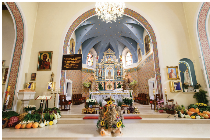
Msza św. w kościele parafialnym.