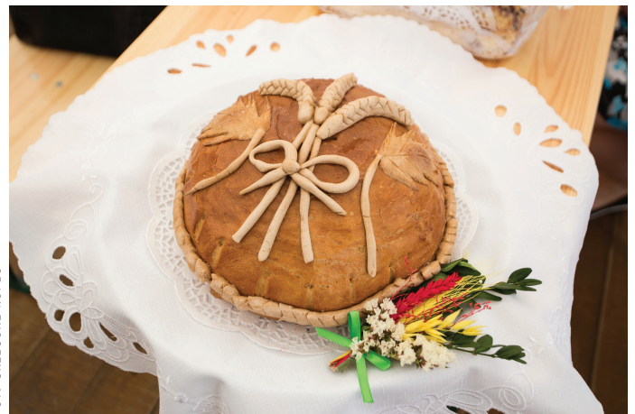
FOT. GRZEGORZ KOPEĆ