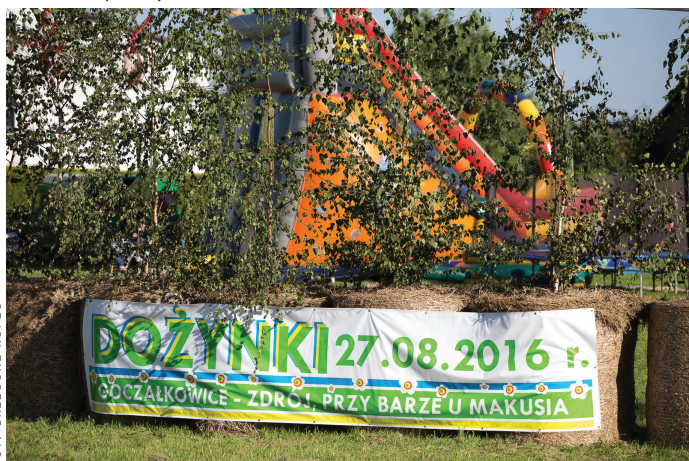
Dekoracja na łące dożynkowej.