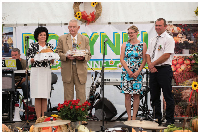
Uroczyste przekazanie Chleba Dożynkowego Wójtowi Gminy i Przewodniczącemu Rady.