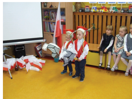
FOT. ARCH. PP. NR2

Zanim się jednak rozstaliśmy wspólnie nauczyliśmy się krótkiego refrenu piosenki pt. „Jesteśmy Polką i Polakiem”, co zostało wspólnie odśpiewane przez dzieci z wszyst-