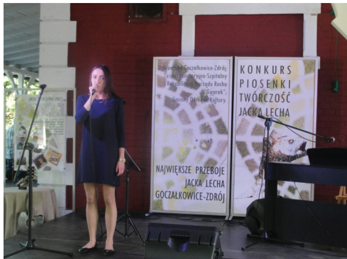
Laureatka Grand Prix IV Konkursu Piosenki Jacka Lecha.

Z kolei, w niedzielę, 22 maja, po raz czwarty, na werandzie restauracji Uzdrowskiej, odbył się Konkurs Piosenki Jacka Lecha. Impreza, która ma na celu upamiętnienie postaci popularnego w latach 60-tych i 70-tych ubiegłego wieku artysty, lidera zespołu Czerwono-Czarni, u schyłku swej kariery koncertującego w goczałkiewickim źródle, skierowana