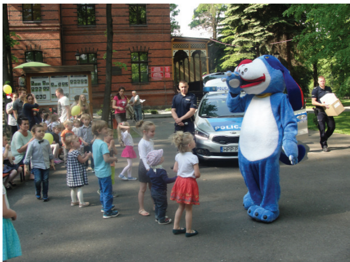
"Sznupek" - maskotka policyjna w towarzystwie dzieci i funkcjonariuszy.