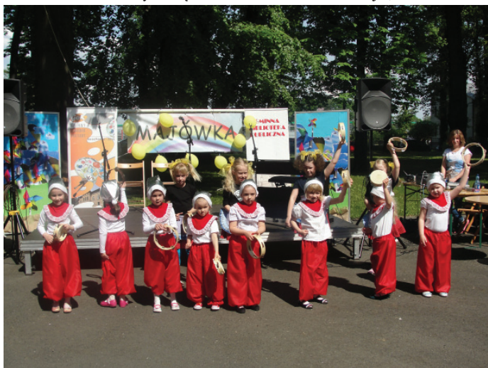
Występ dzieci z warsztatów tanecznych GOK-u.