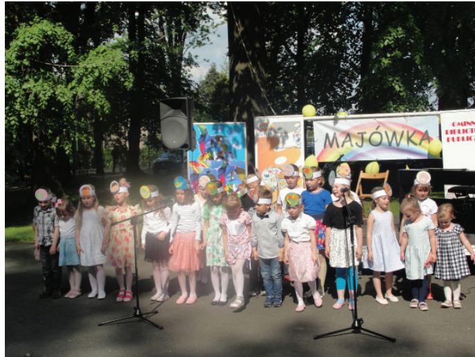
Występ dzieci z warsztatów językowych GBP.