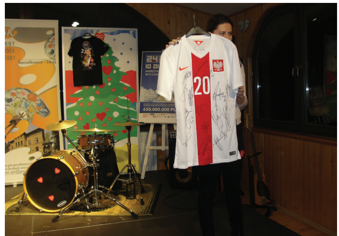
Licytacja koszulki Łukasza Piszczka z podpisami kadry polskiej drużyny piłkarskiej.