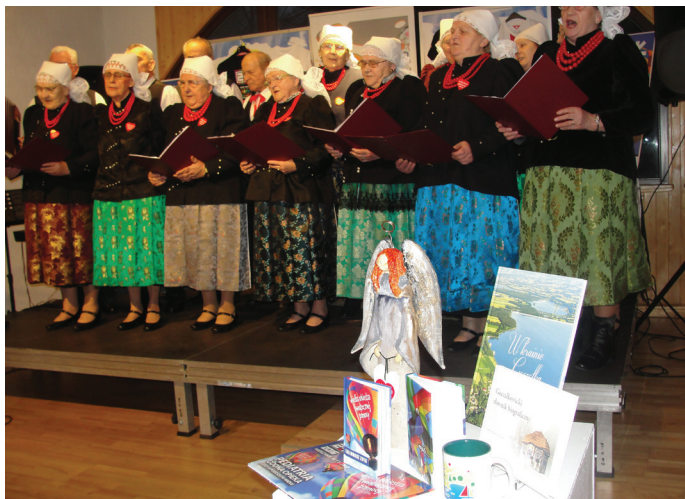
Koncert Zespołu Folklorystycznego Goczałkowice.