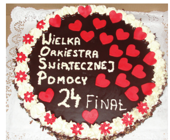
Tort przekazany do licytacji z piekarni „u Englerta”.

Serdecznie dziękujemy za tak hojne wsparcie Wielkiej Orkiestry Świątecznej Pomocy. Mamy nadzieję, że tak wyjątkowa akcja z powodzeniem będzie organizowana w przyszłości, bo jak wszyscy wiemy, wśród nas nigdy nie zabraknie